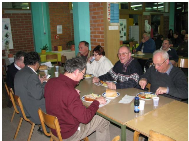
Zahvala OŠ Bled za pogostitev