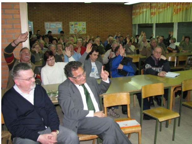
Izvolitev novega UO