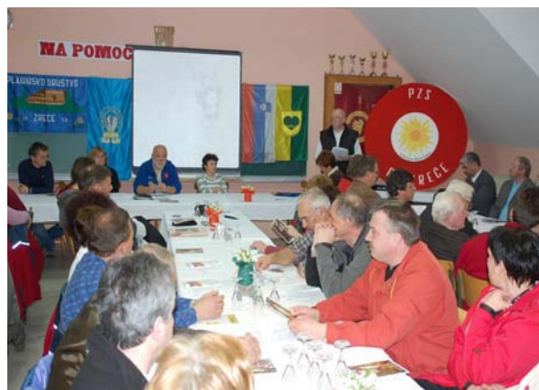
Zreški planinci so se zbrali na občnem zboru