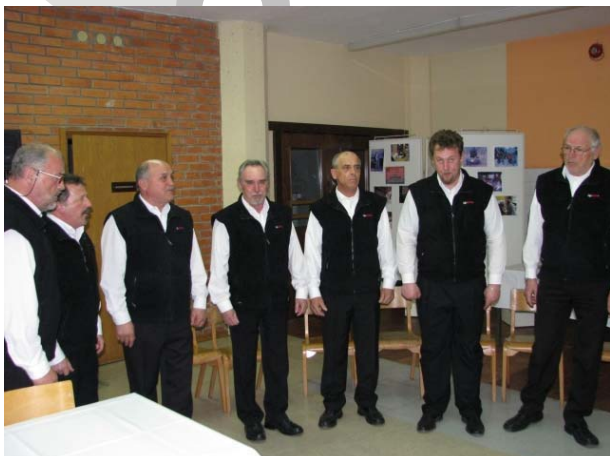
Oktet Lip Bled