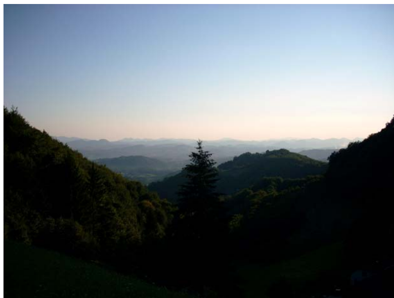
Razgledi proti jugu: