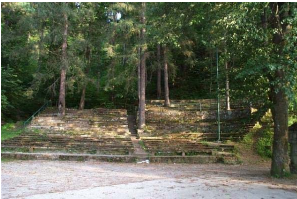
Letni oder v Rušah