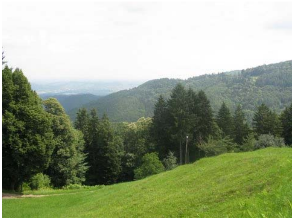
Utrinek – razgled proti Mariboru in Slovenskim goricam