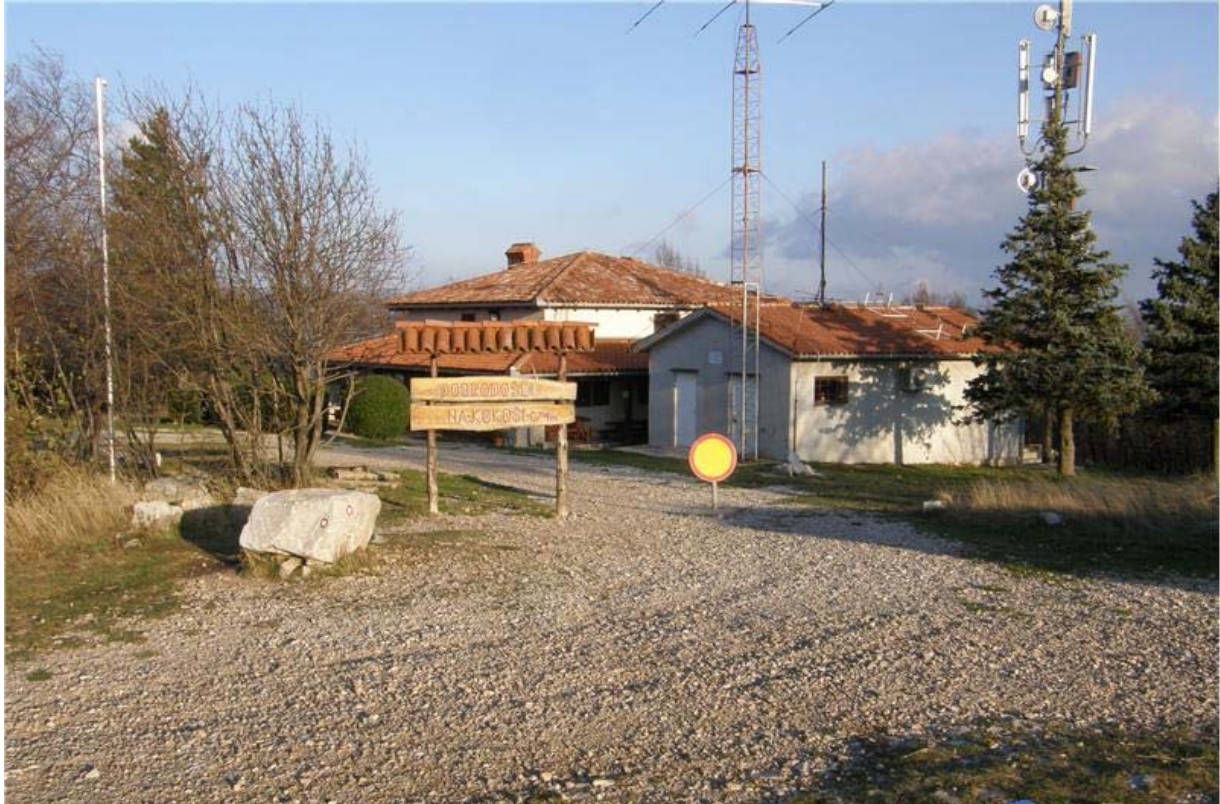
Koča PD Sežana na Kokoši

Kokoš (mnogi jo ljubkovalno imenujejo tudi Kokoška) je eden od vrhov gričevja, ki ločujejo Lokavsko polje od Tržaškega zaliva. Na gričevje, ki je preprejeno s pešpotmi, kolesarskimi in jahalnimi stezami se je mogoče povzpeti iz več smeri: iz Lipice, Lokve in iz Vrhpolj ter iz italijanske strani, iz Gročane. Vse te poti obiskovalcem omogočajo izbiro zanimivih krožnih poti.