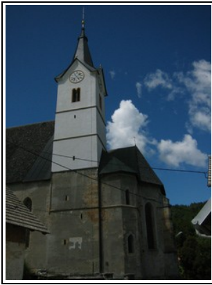
Gotska cerkev iz leta 1526 v Dvoru