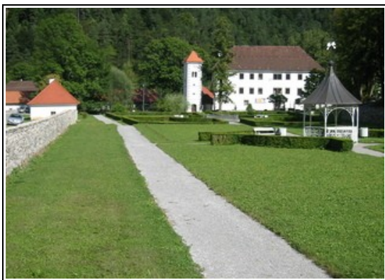
grajski kompleks s parkom