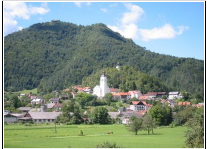
Polhograjska gora, Stari grad in cerkev Marijinega rojstva v Polhovem Gradcu