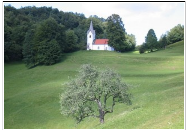
cerkev Svete Uršule