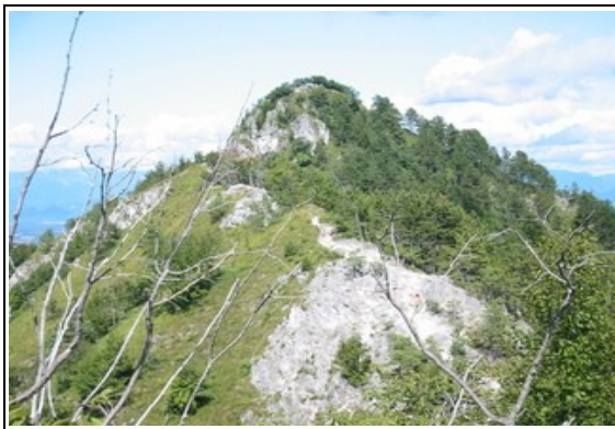
Pogled z Male Grmade na vrh Polhograjske Grmade