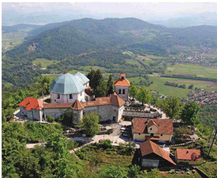
Zakaj na Šmarni gori še vedno zvoni ob pol poldne?