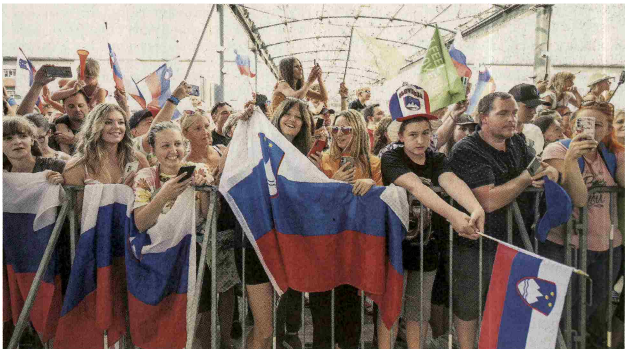
Slovenske košarkarje je po prihodu iz Tokia na brniškem letališču pričakala množica navijačev.