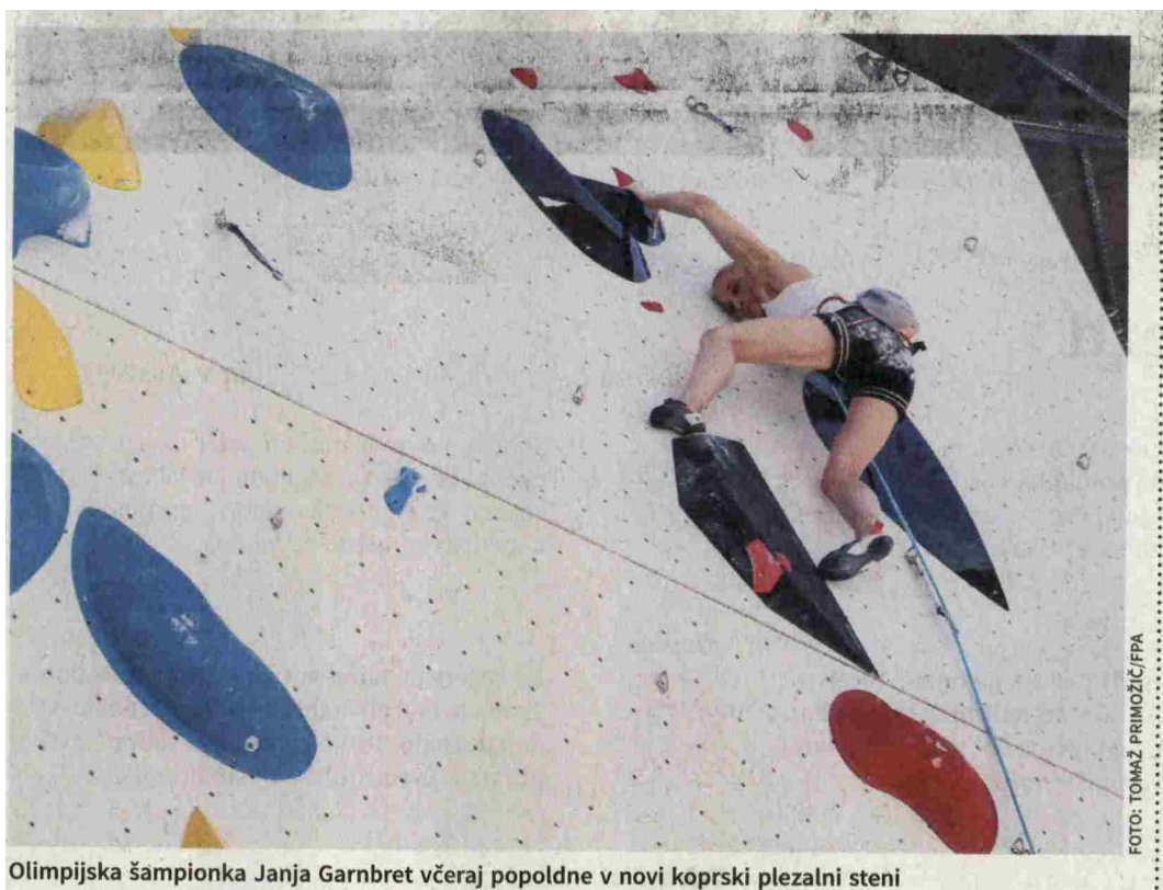
Olimpijska šampionka Janja Garnbret včeraj popoldne v novi koprski plezalni steni