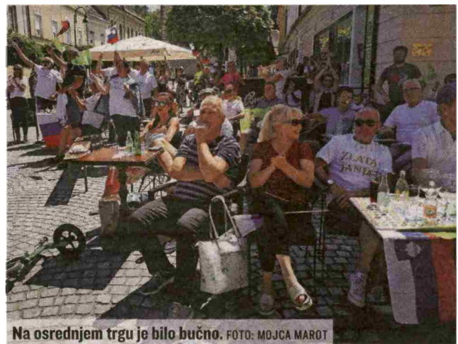
Na osrednjem trgu je bilo bučno.