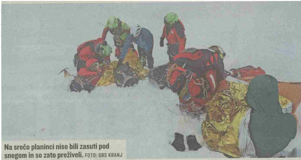
Na srečo planinci niso bili zasuti pod snegom in so zato preživeli.