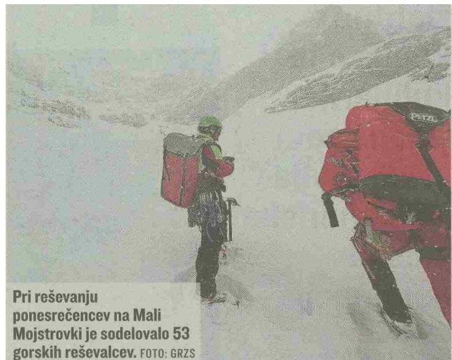
Pri reševanju ponesrečencev na Mali Mojstrovki je sodelovalo 53 gorskih reševalcev.