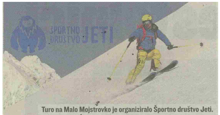
Turo na Malo Mojstrovko je organiziralo Športno društvo Jeti.