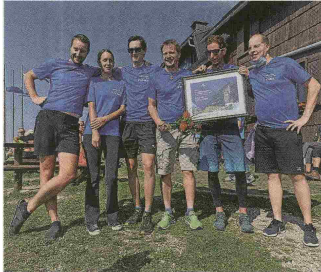
Oskrbniška ekipa Koče na Kriški gori