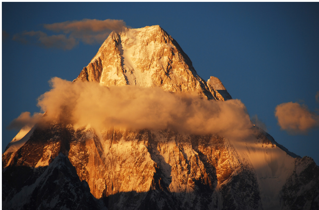
Gašerbrum 4, 7925 m, Karakorum