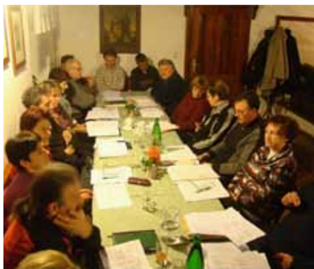
Na seji MDO PD Posočja