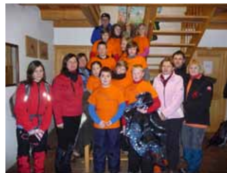
Mladinski odsek PD Kočevje že vrsto let pripravlja proslavo ob kulturnem prazniku

Mesec je naokoli in Mladinski odsek PD Kočevje se je zopet odpravil na potep. Mlajšim planincem je malce zagodlo vreme s sneženjem in nizkimi temperaturami, starejši pa smo se na slovenski praznik kulture, 8. februarja, že tradicionalno v čudovitem zimskem dnevu odpravili do Koče pri Jelenovem studencu, kjer smo pripravili manjšo slovesnost v spomin na največjega slovenskega pesnika.