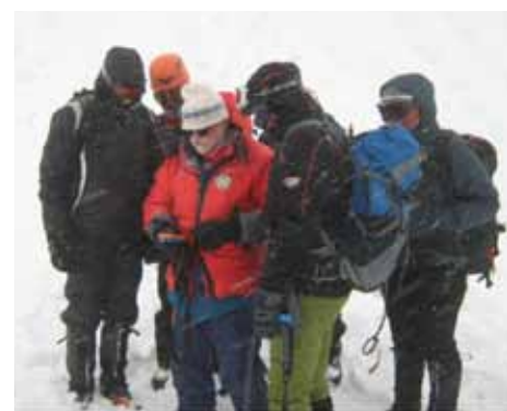
Udeleženci so v praksi spoznali učinkovitost digitalne plazovne žolne v primerjavi z analogno

V teoretičnem delu (v Domžalskem domu na Mali planini) so udeleženci spoznali vse o snegu in snežnih plazovih, o prvi pomoči s podarkom na postopkih oživljanja in poškodbah zaradi mraza, o osnovah varne hoje v gorah v zimskem času, potrebni opremi, uporabi in hoji s palicami, derezami, cepinom, krpljami, ..., o plazovnem trojčku, pa tudi o nevarnostih – objektivnih in subjektivnih, ter kako ravnamo ob morebitni nesreči. Na praktičnem delu pa so spoznali in preizkusili stabilnost snežne odeje po norveški metodi, delo s plazovnimi žolnami, pravilno hojo z in brez derez na različnih pobočjih, zaustavljanje s cepinom, sondiranje, nahrbtnik ABS, delo reševalnega psa ... Udeleženci so skozi prave zimske razmere – izjemen mraz, močan veter, vejevica in nizke temperature – lahko preizkusili tudi svojo osebno planinsko opremo.