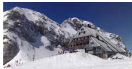
Kredarica, najvišja točka tekme 'Triglavski smuk'

Društvo za razvoj turnega smučanja in GRS Mojstrana organizirata v soboto, 24. marca 2012, Triglavski smuk - DRŽAVNO PRVENSTVO V PARIH in rekreativni vzpon na Kredarico s smukom v Krmo.