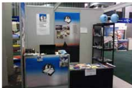
Prostor PZS na sejmu Alpe-Adria: Turizem in prosti čas!

Planinska zveza Slovenije je konec januarja (26.–29. januar 2012) sodelovala na sejmu Alpe-Adria: Turizem in prosti čas. Na našem prostoru ste si lahko kupili planinsko literaturo, vodnike, zemljevide, se včlanili v planinsko društvo in naročili našo odlično revijo Planinski vestnik.