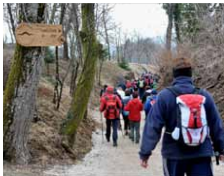
Poti so preplavile reke pohodnikov