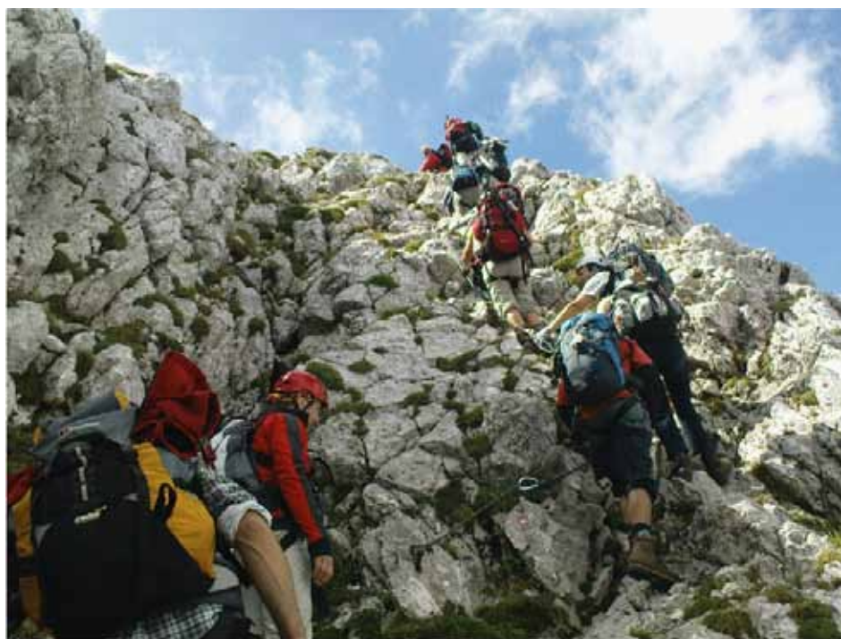
Stopimo skupaj tudi v letu 2012

Ponosni smo, da smo v letu 2011 kljub vsesplošnim kriznim časom uspeli povečati število članov posameznikov. 1358 članov več pomeni 2,4 odstotka ljubiteljev gora več, ki čutijo pripadnost organizaciji. Med največjim dvigom članstva (6,6 %) smo zabeležili dvig števila tistih, ki so najaktivnejši odrasli in se podajajo tudi v razna gorstva sveta. Večje število je tudi odraslih članov, in sicer kar za 2,9 %, kar pomeni, da je bilo v letu 2011 v PZS včlanjenih 37.746 članov B kategorije. Tudi najmlajših, predšolskih in osnovnošolskih otrok, je bilo v lanskem letu več včlanjenih, skupaj 228 več oziroma skupaj 13.867 najmlajših članov, čemur gre prav gotovo zasluga celostni vsebinski in oblikovni prenovi programov za najmlajše in mlade planince, programov Ciciban planinec in Mladi planinec Mlada planinka. 2,4 % članov več pomeni toliko več ljudi, ki zaupajo v programe planinskih društev in Planinske zveze, ki si želijo druženja s prijatelji gora, ki želijo varnejše obiskovati gore, ki se zavedajo pomembnosti skupnega prizadevanja za ohranjanje gorskega sveta, in ki potrjujejo, da so delo, cilji in zastavljeni načrti usmerjeni v pravo smer.