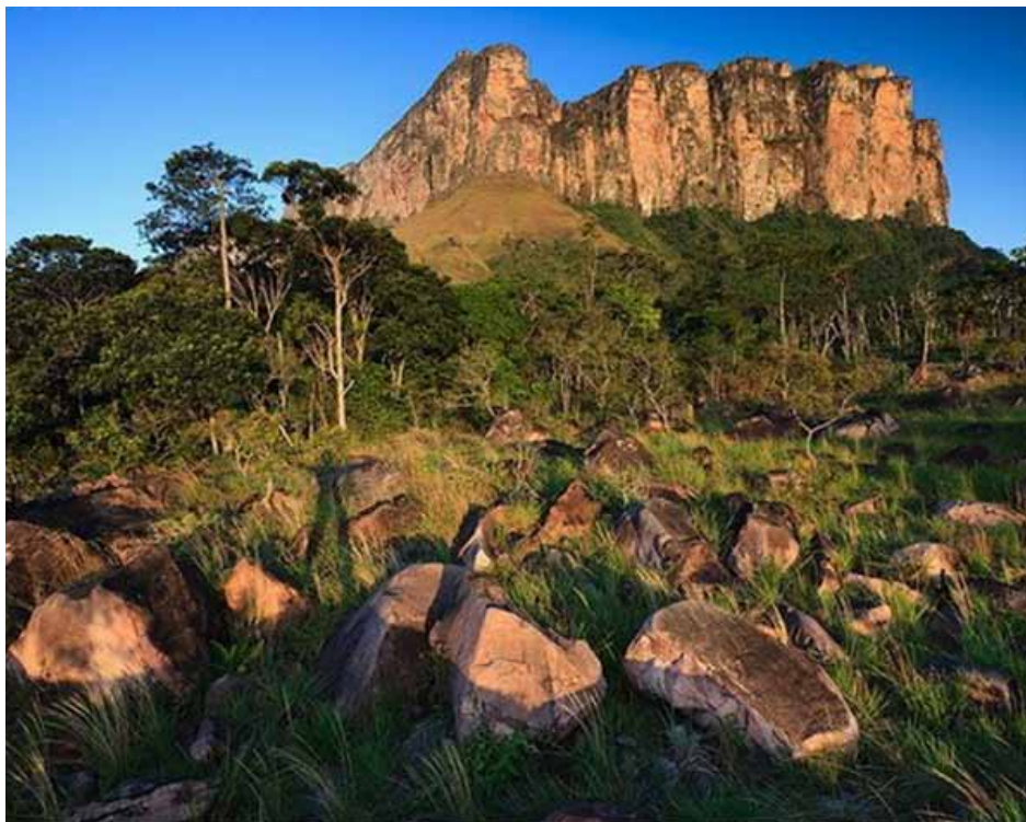
Acopan Tepui