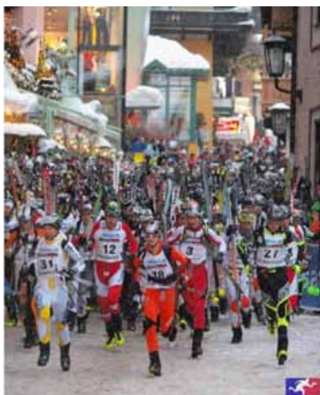
Skupinski start

Več na spletnem mestu: http://www.pzs.si/novice.php?pid=6570 .