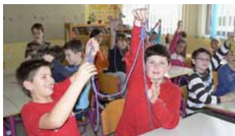
Takole smo vozljali

Mladi planinci Osnovne šole Ljubečna so ponovno preživeli dan v planinskem duhu. Tokrat ne na planinskem pohodu, ampak na tradicionalnem srečanju vseh planinskih skupin, ki delujejo na šoli, in sicer v soboto, 21. januarja 2012. Planinski krožek OŠ Ljubečna deluje v okviru Mladinskega odseka PD Celje Matica .