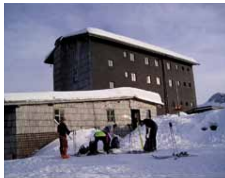
Dom na Komni, foto Elvira Emmenegger

Radio 1 in glavni sponzor Big Bang akcije sta v petek, 2. marca, ob 12. uri, prekinila in zaključila akcijo. Kot so zapisali v sporočilu za javnost, so upoštevali želje Planinske zveze Slovenije.