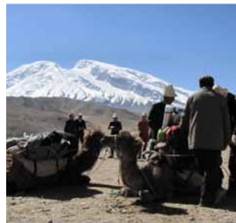
Z odprave Mustagh Ata, foto Iztok Cukjati

Iztok Cukjati in Simon Brezovar, tel: (+386) 40 186 268, e-mail: icukjati@gmail.com , www.odprava.si .