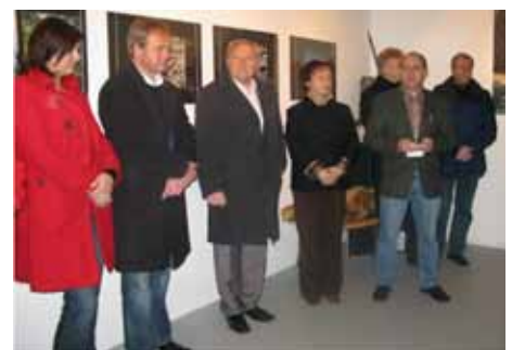
Na odprtju razstave MDO PD Podravja v Rušah

V četrtek, 5. 1. 2012, je bilo v Rušah slovesno. Z razstavo MDO PD Podravja se je zaključil niz praznovanj ob 110-letnici ustanovitve Podravske podružnice.