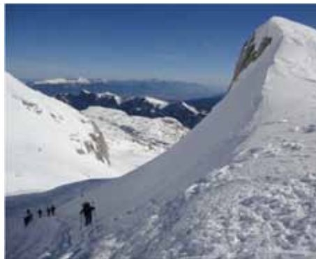
Dobra priprava, spremljanje razmer, znanje o uporabi zimske opreme in uporaba le-te ... SREČNO pot!

Kaj moramo vedeti, če se pozimi odpravljamo na pohod, turo; kakšno opremo potrebujemo, na kaj je potrebno še posebej paziti, kakšno težavnost izbrati, če nismo večji hoje v gorah pozimi ... Koristne nasvete smo objavili na spletni strani PZS , poglejte jih na: http://www.pzs.si/novice.php?pid=6581 .