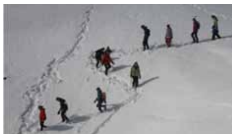
Varnejše v gore že od mladih nog