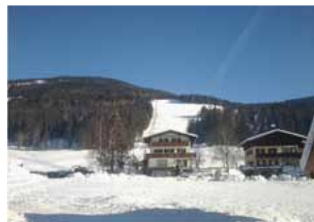
Prizorišče tekme je bilo smučišče v ozadju

Več na spletnem mestu PZS: http://www.pzs.si/novice.php?pid=6516 .