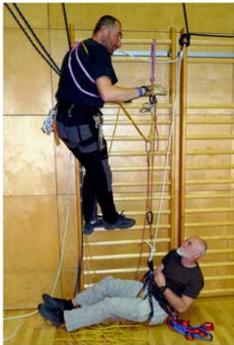
Na usklajevalnem seminarju inštruktorjev planinske vzgoje

Ker je v programu izpopolnjevanj VPZS za obdobje 2012–2014 snov zahtevnosti za vodnike kategorije C oz. E, je bil na 3. seji Podkomisije za usposabljanje VK PZS, 20. decembra 2011, sprejet sklep, da se s seznama inštruktorjev izbere tiste, ki imajo kategorije vodenja C oz. E ter inštruktorje alpinizma in se jih povabi na posebno usklajevanje. Tisti, ki so se vabilu odzvali, bodo prevzeli naloge nosilca praktičnega dela na izpopolnjevanjih.