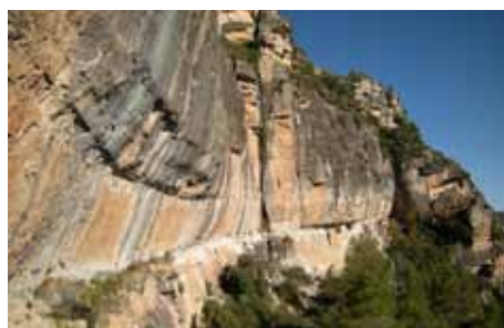
Can Piqui Pugui, foto Gašper Pintar

prou, 8b, in bil na pogled uspešen v smeri Kalea Borroka, 8b+.