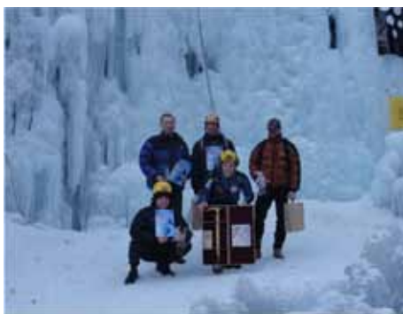
Tekmovalci - slovenskega pokala in tekme za vsakogar - so se takole veselili zmage in stopnič