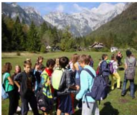
Otroško uživanje v prelepi naravi je pregnalo vse strahove, da nam ne bi uspelo

Ker je vreme ključnega pomena, smo spremljali vremensko napoved vse do četrta, 29. 9. 2011, ko smo imeli podhod. Učenci šestega in sedmega razreda so lahko izbrali med Koželjevo potjo v Kamniški Bistrici in med Veliko planino. Za učence osmega in devetega razrede pa smo organizirali pohoda iz Stare Fužine na Vogar in okoli Bohinjskega jezera.