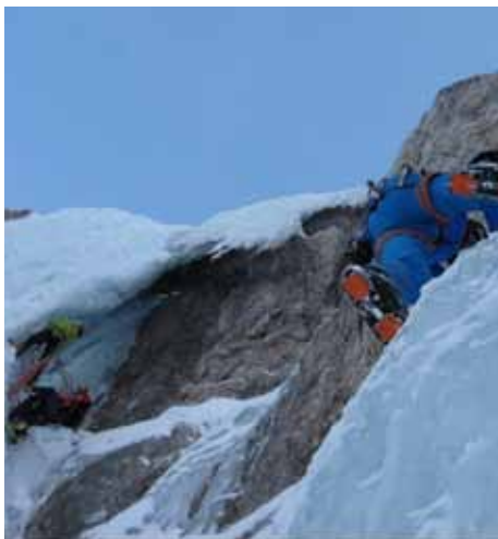
Novi alpinistični inštruktorji v slapovih pod Prisojnikom

V četrtek, 16. februarja 2012, smo imeli v slapovih pod Prisojnikom popravne izpite za nove alpinistične inštruktorje iz lednega plezanja. Na letošnji seminar za alpinistične inštruktorje, ki ga tako kot že dve leti vodi Aljaž Anderle, se je prijavilo 9 kandidatov. Po lednem plezanju je sedaj v marcu na sporedu zimski in ledeniški del, sredi aprila pa jih čaka letna tehnika, ki se bo zaključila z izpiti v mesecu maju 2012.