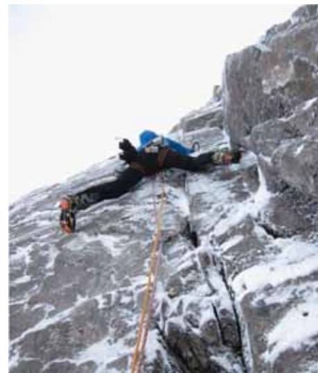
V stenah Škotske

Pohvala organizatorjem (BMC) za dobro izpeljan teden, zahvala pa tudi Komisiji za alpinizem PZS za finančno pomoč.