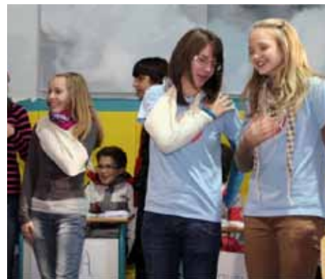
Mladi planinci so se izkazali tudi pri praktičnih nalogah, tu pri prvi pomoči

V Rušah se je na tokratnem Državnem tekmovanju Mladina in gore pomerilo 24 najboljših skupin mladih planincev osnovnošolcev od 6. do 9. razreda iz vse Slovenije, ki so se na regijskih tekmovanjih 12. novembra 2011 najbolj izkazale. Tekmovanje Mladina in gore je vedno organizirano pod okriljem Mladinske komisije PZS, soorganizatorja zaključnega, torej državnega tekmovanja pa sta planinsko društvo in osnovna šola zmagovalcev prejšnjega leta. Tokrat pa so državno tekmovanje pripravili v kraju Božjih šteng, drugouvrščene ekipe na 22. Državnem tekmovanju Mladina in gore, saj je lansko leto drugič zapored zmagala ekipa iz Slivnice pri Celju. Osnovna šola Janka Glazerja Ruše in Planinsko društvo Ruše sta tako zavihala rokave in pripravila odlično prireditev in tekmovanje. Soorganizatorja sta bila še Zavod za šport RS Planica in Ministrstvo RS za šolstvo in šport.