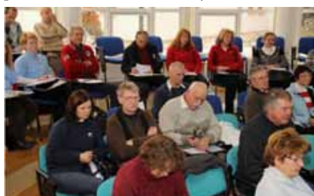
Delegati in gosti na Zbor delegatov KVG N PZS so v razpravi aktivno sodelovali

V letošnjem letu bo prednostna naloga dokončanje Kodeksa oz. Strategije varstva narave v slovenskih gorah. Pripravili bodo tudi publikacijo Varstvo narave v slovenskih gorah, strokovna stališča do načrtovanja različnih dejavnosti in prostorskih posegov v gorsko naravo, izobraževanja in usposabljanja za varuhe gorske narave, vanje vključili tudi nove vsebine, povezovali se bodo z odbori za varstvo gorske narave po meddruštvenih odborih planinskih društev, sodelovali v vseslovenski akciji Očistimo Slovenijo 2012, ki bo tokrat organizirana tudi istočasno povsod po svetu; seveda pa bodo tudi ažurno spremljali stanje in nedovoljene posege v gorski prostor ter o tem informirali javnost.