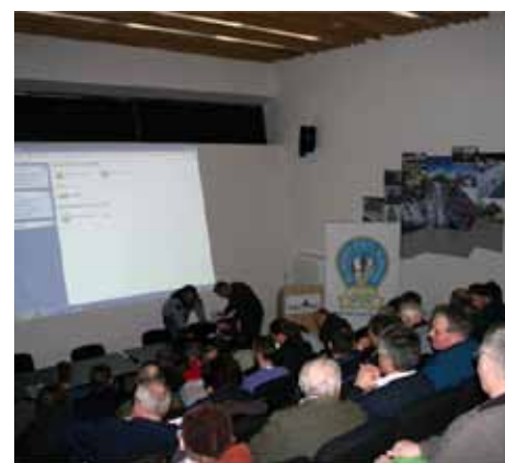
Številni zbrani so prisluhnili predstavitev in v razpravi tudi sami sodelovali