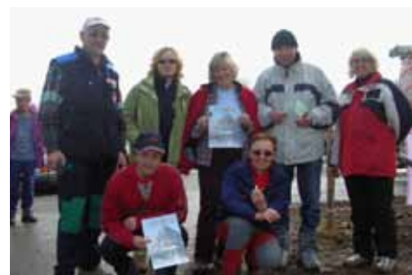
Tudi letos so z zlato značko odlikovali številne pohodnike, ki so se pohoda udeležili 5-, 10-, 15-, 20-, 25 in 30-tič, vsi pohodniki pa so prejeli diplome

v spomin na padle borce pod Arihovo pečjo, je bil povsem uspešen.