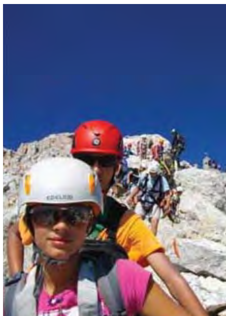
Radi hodimo v gore

Mladinska komisija je eden od najmočnejših členov Planinske zveze Slovenije. Skrbi za najmlajšo populacijo ljubiteljev planin. Svoje aktivnosti ima razporejene na različnih področjih: od orientacije, izobraževanja za mlade in dela z mladimi, družabnosti in še bi lahko naštevali. Delujemo na različnih projektih znotraj in zunaj meja Slovenije. Smo stalni član YC UIAA, sodelujemo pa tudi s prostovoljnimi organizacijami v Sloveniji. Mladinska komisija ima v skrbništvu tudi Planinsko učno središče Bavšica, s katerim skrbno upravlja.