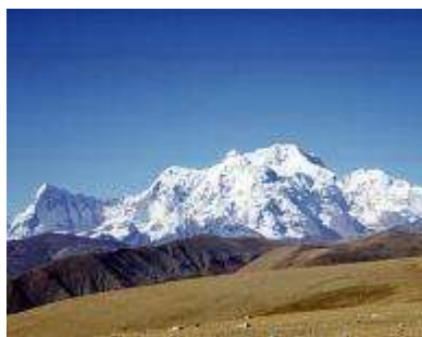
slovenjbistriška pa na Šišo Pangmo.