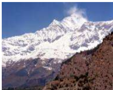
mariborska odprava gre na Daulagiri VII,