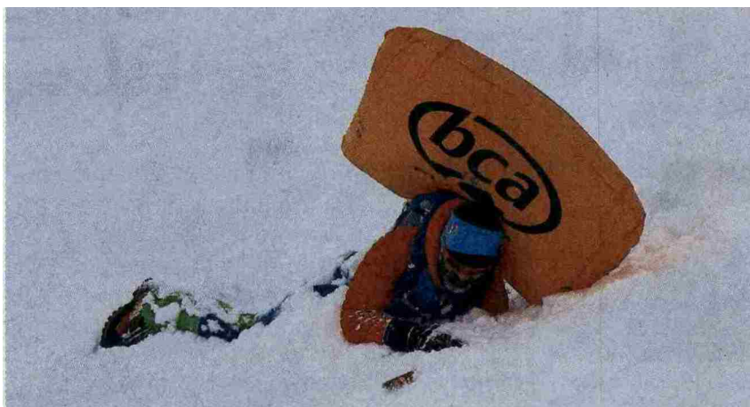
Trenutno je največja nevarnost kložastih plazov, ki so na območju držav alpskega loka najpogostejši vzrok za nesreče in smrti v gorah.

gom. Zaradi ponovnega sneženja, ki se pričakuje v nedeljo, se bo povečala tudi nevarnost snežnih plazov. Glede na plazovno napoved in tendenco snežnih razmer svetujemo, da se v prihodnjih dneh izogibamo sredogorja in visokogorja ter se odpravimo na vrhove, za katere je znano, da niso izpostavljeni snežnim plazovom, in še to po ustaljenih poteh (Pokljuka, planina Konjščica, Velika planina, Uršlja gora, Šmarna gora ...). V vsakem primeru pa imejte s seboj nahrbtnik s toplimi oblečili, kapo in rokavicami, čelno svetilko, prvo pomočjo, toplo tekočino in kakšnim priboljškom.«