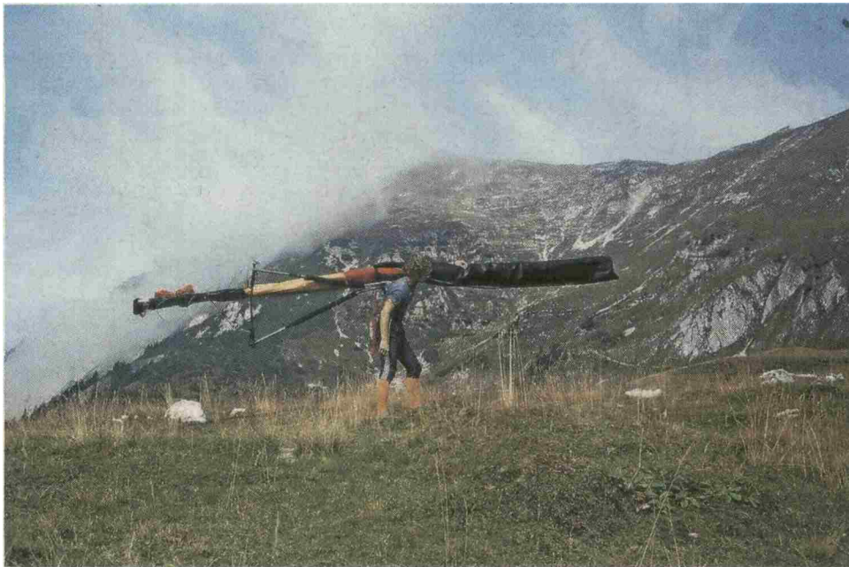
Tihotapski podvig leta 1981 – Iztok Tomazin nosi zmaja na Veliki vrh v Košuti.