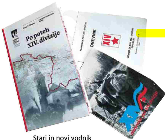
Stari in novi vodnik