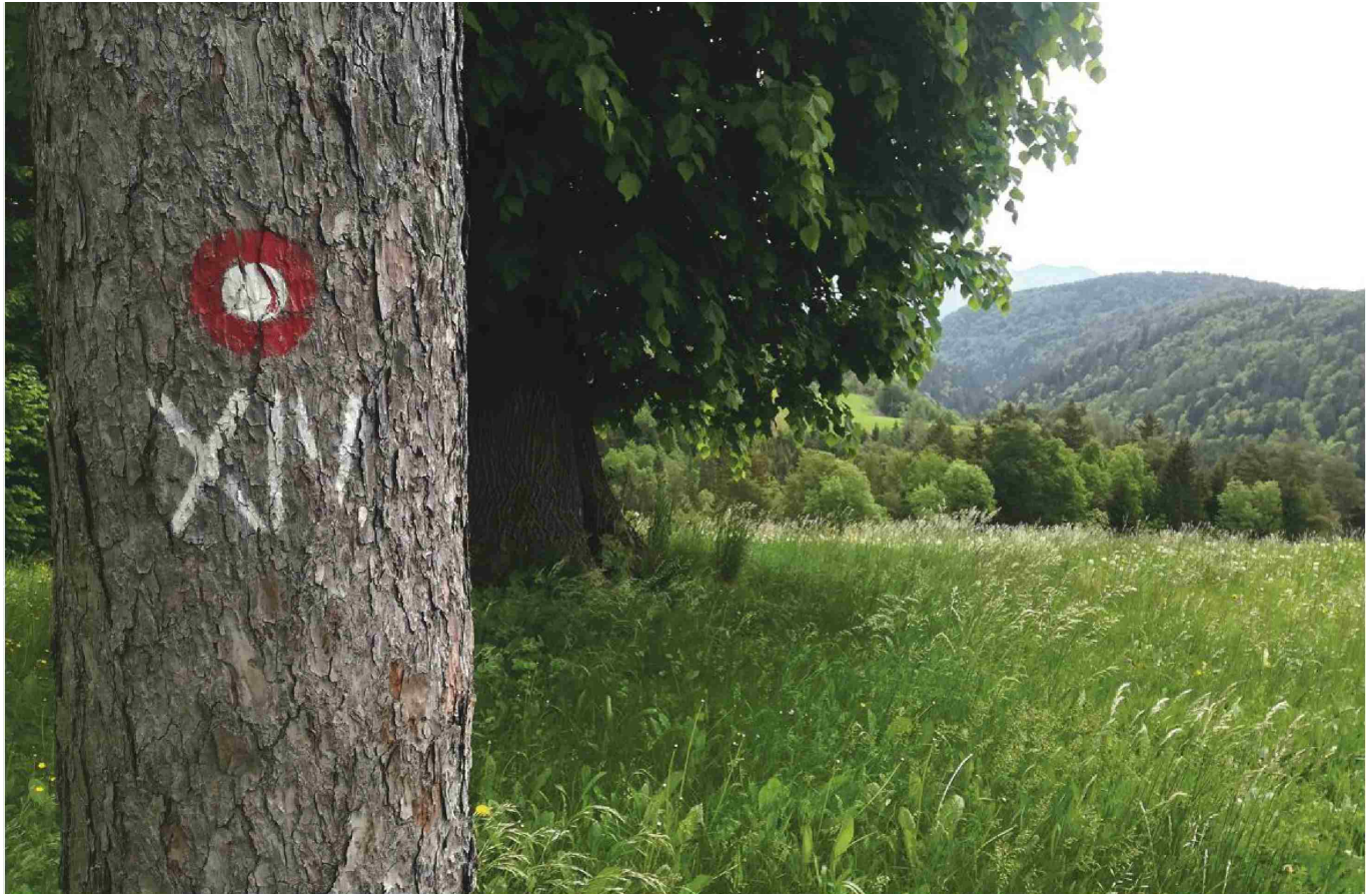
Označba, po kateri prepoznamo pot spomina na težek pohod XIV. divizije.