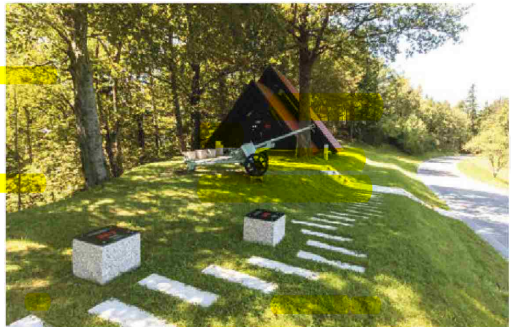
Na Graški gori je spominski park XIV. divizije.