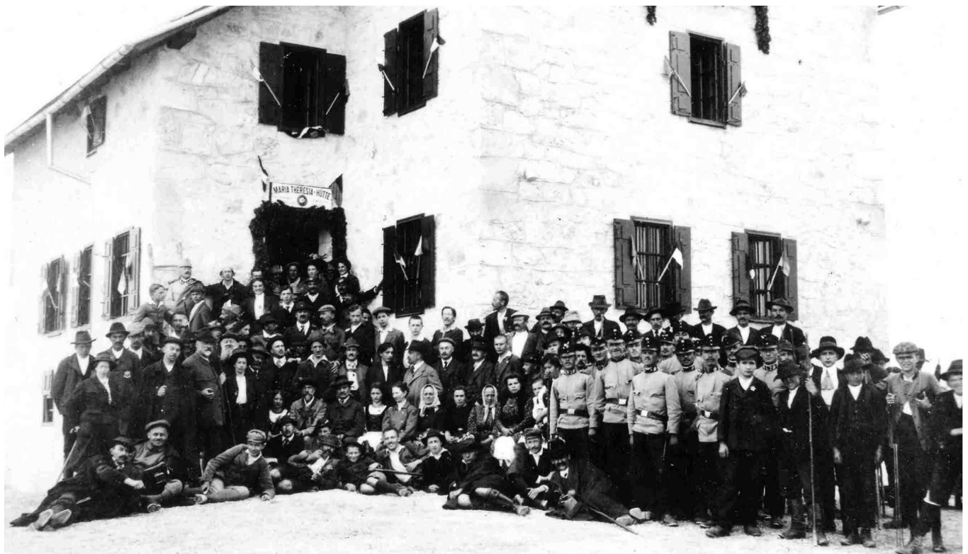
Svečanega odprtja Koče Marije Terezije se je udeležila množica povabljenih gostov. Kot Dom Planika pod Triglavom nas skoraj nespremenjena pozdravi še danes.