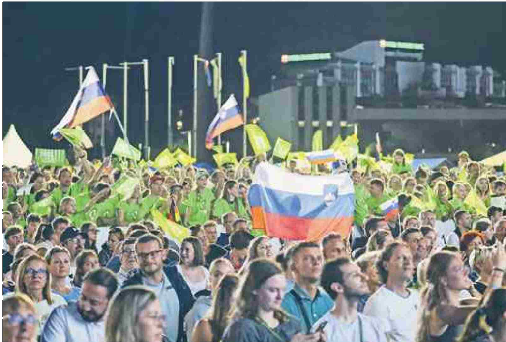
Slovenska srca za Janjo Garnbret