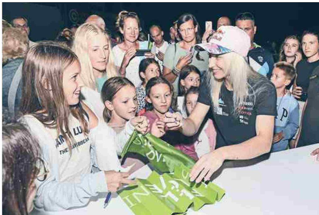
Avtogram dvakratne olimpijske šampionke - najbolj zaželen sobotni suvenir z Bonifike