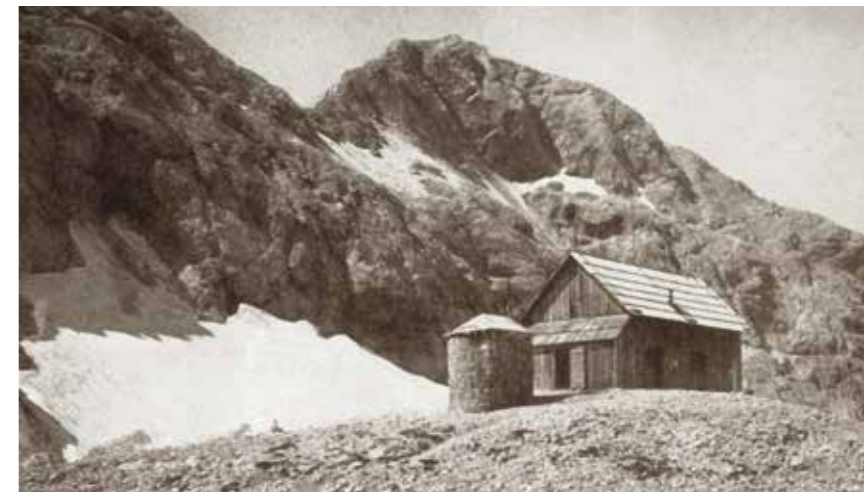
Prva Aljaževa koča na Kredarici in Aljaževa kapela, ki je bila po 2. svetovni vojni porušena, čeprav so sredstva zanjo prispevali Jakob Aljaž in slovenski planinci.