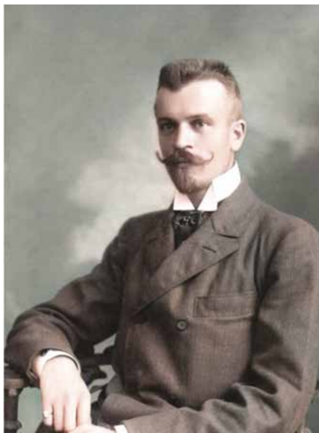
Sloviti avstrijski alpinist Karl Domenigg je bil leta 1906 vodilni član naveze, ki je prva preplezala Nemško smer v severni steni Triglava.