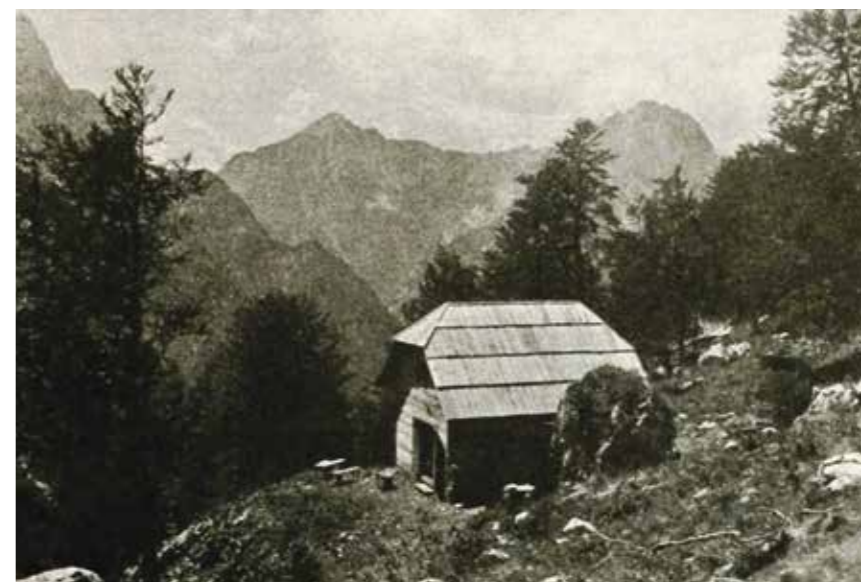
Koritniška koča pod Mangartom se je po rapalski razmejitvi znašla v Italiji, ki jo je pustila propasti.

Meja je tekla od Tromeje nad Ratečami na Jalovec, čez Mojstrovke na Vršič in čez Prisojnik na prelaz Luknja. Od