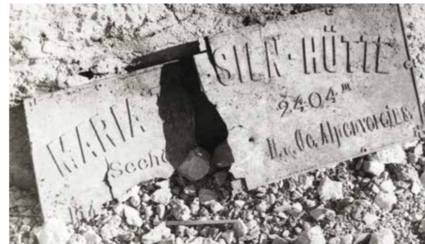
Razbita tabla koče Marije Terezije predstavlja konec nekega zgodovinskega obdobja na Kranjskem in obenem organiziranega planinstva na naših tleh.