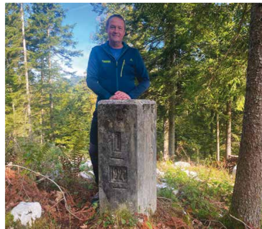
Ob glavnem mejniku rapalske meje št. 46 pri Kalcah nad Logatcem. Glavnih mejnikov je bilo na ozemlju sedanje Slovenije 61, zagotovo najbolj znan, št. 10, je stal na vrhu Triglava.