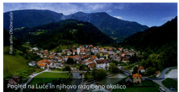
Pogled na Luče in njihovo razgibano okolico

Zanimiva ponudba nastanitve bo zadovoljila različne želje in okuse. Pomemben del turistične ponudbe je tudi lokalna kulinarika, kjer prevladujejo domače kmečke jedi iz žit in mleka ter različni suhomesnati izdelki. Od teh je najbolj znan zgornjesavinjski želodec, ki je geografsko zaščitena specialiteta.