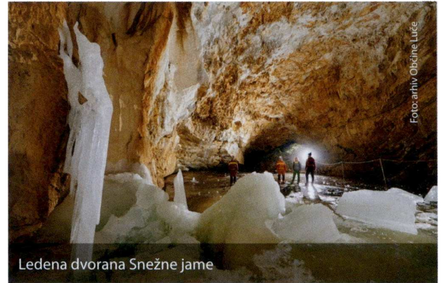
Ledena dvorana Snežne jame

Na zahodni strani Luč se dviga Dleskovška planota, visokogorska kraška planota, ki se razprostira med dolinami Lučke Bele, Podvolovljeka in Robanovega kota. Tu se je takoj po naselitvi razvilo planinsko pašništvo, ki je vitalno še dandanes. Značilnost planote so kopasti, lahko