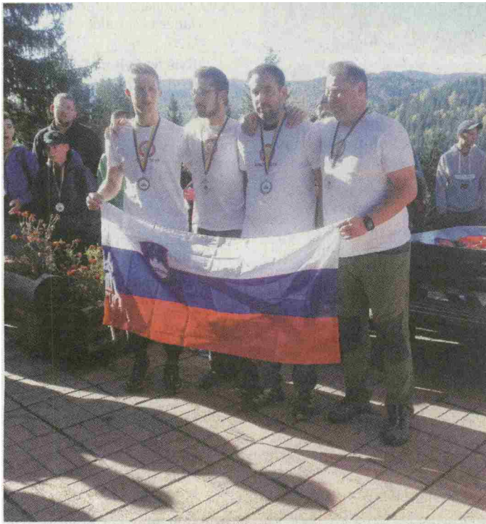
Podprvaki prihajajo iz Šoštanja