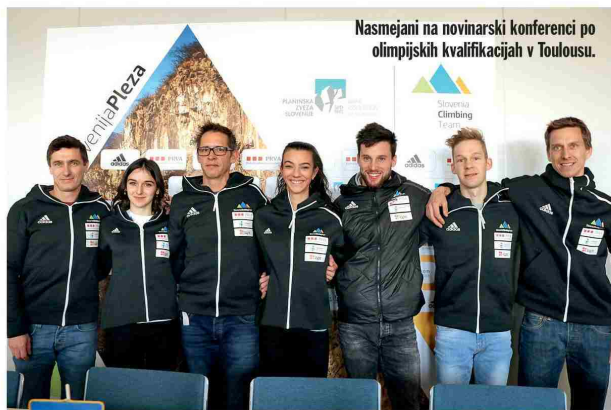
Nasmejani na novinarski konferenci po olimpijskih kvalifikacijah v Toulousu.