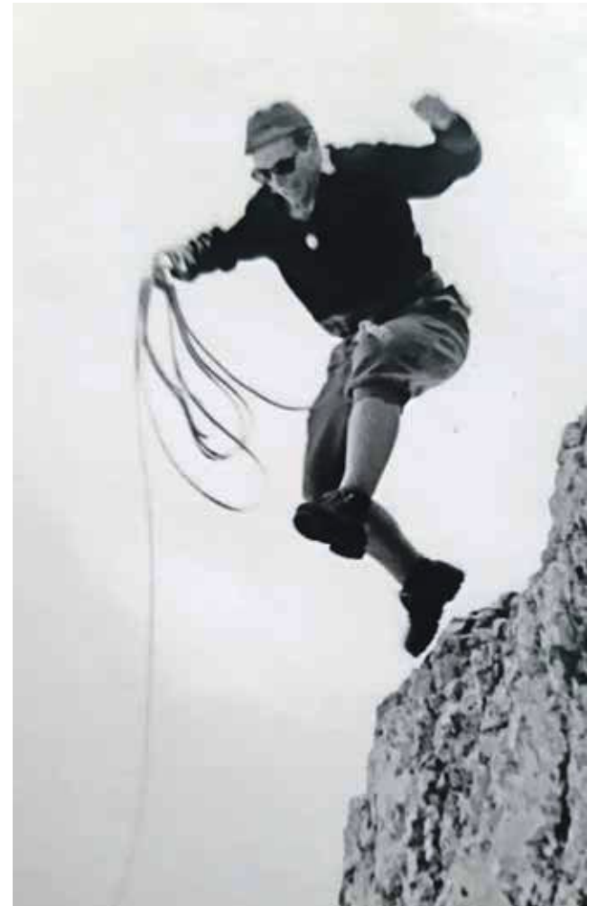
Kot najboljši alpinist prve povojne generacije je s splezalci premikal meje mogočega v alpinizmu.

je v zadnjih letih premagal na sobnem kolesu.