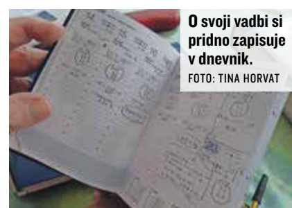
O svoji vadbi si pridno zapisuje v dnevnik.