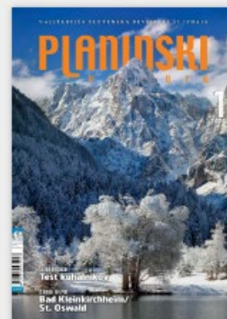
Planinski Vestnik 01. 01. 24