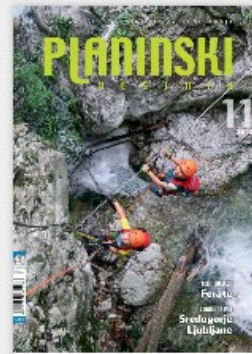
Planinski Vestnik 1. 11. 22