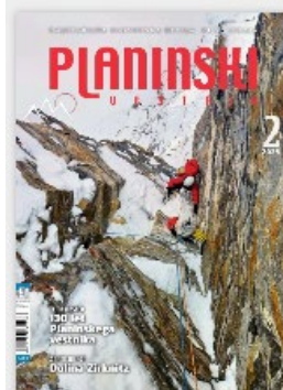
Planinski Vestnik 19. 02. 25