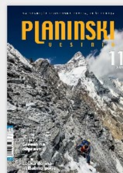
Planinski Vestnik 1. 11. 24