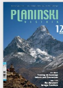
Planinski Vestnik 1. 12. 23