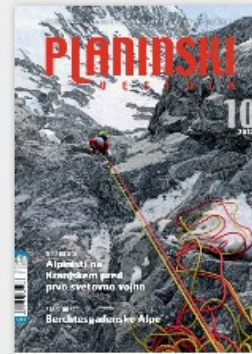
Planinski Vestnik 1. 10. 22