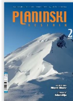
Planinski Vestnik 01. 02. 24