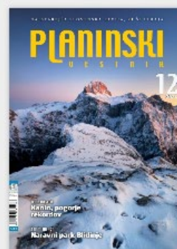
Planinski Vestnik 18. 12. 24