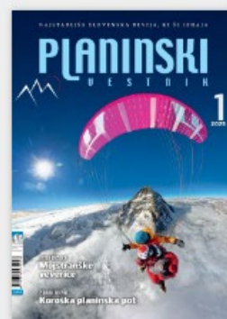
Planinski Vestnik 16. 01. 25