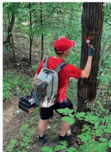
Markiranje poti na Gozdniku

zasmilila, ko sva povedala, da sva iz Maribora pes prišla do njih. To mi bil edini takšen primer. V Prešnici pod Slavnikom sva pri neki domačiji prosila za vodo. Ko sva jim povedala, od kod sva prišla pes, so nama sami od sebe pripravili konkretno malico.