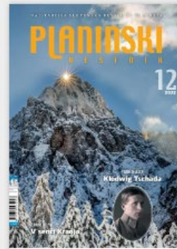
Planinski Vestnik 1. 12. 22