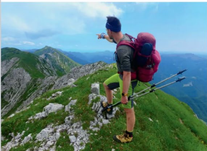
No poti pravi Čmi pravi Arhiv Saso Močka

Se ti kot markacistu in pohodniku zdi, da je Slovenska planinska pot dobro označena? In vama za povprečne pohodnike?