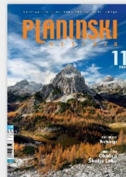
Planinski Vestnik 1. 11. 23