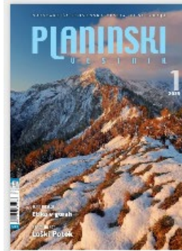
Planinski Vestnik 1. 01. 23