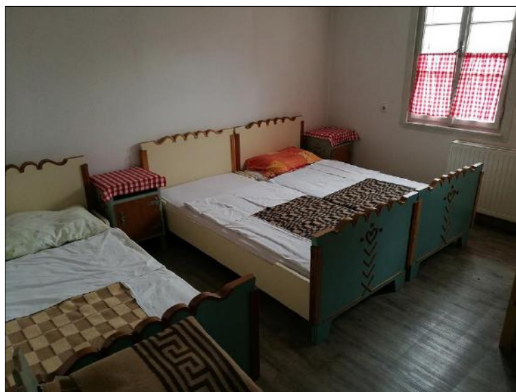
Slika 4: Mihelčičev dom na Govejku

Mihelčičev dom na Govejku: s kočjo upravlja podjetje Biomedica d.o.o, lastnik kočje pa je planinsko društvo Obrtnik Ljubljana.