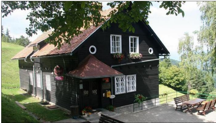
Slika 1: Mihelčičev dom na Govejku, vir siol.net

Mihelčičev dom na Govejku stoji na planoti Gonte, nad dolino Ločnice, v severnem delu Polhograjskega hribovja. Govejek je razloženo naselje samotnih kmetij med Toščem in Osovnikom. Od doma je lep razgled proti severu na Kamniške Alpe ter na Sorško polje, na vzhodu je Menina planina, Posavsko hribovje, Rašica in Šmarna gora ter Ljubljanska kotlina, v bližini pa hribovje nad dolino Ločnice z razglednim Jakobom.