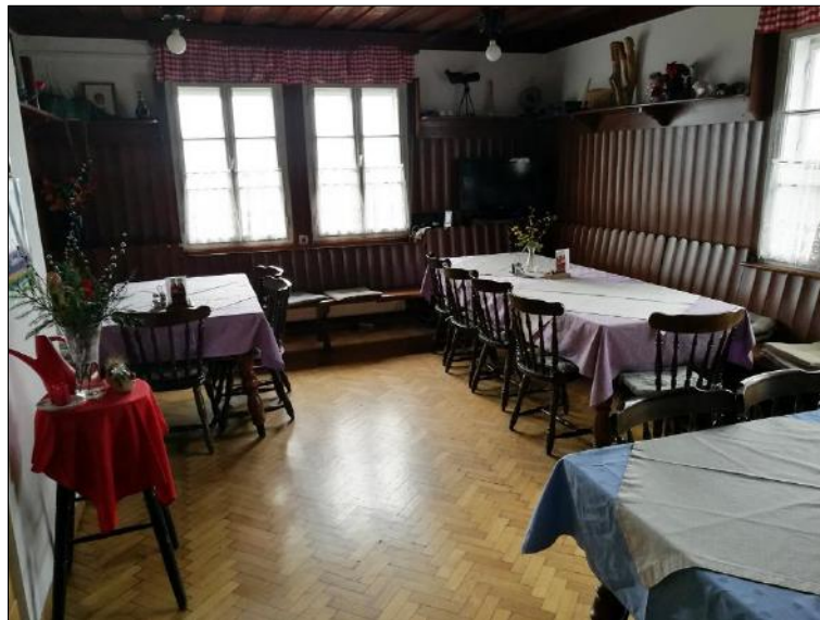
Slika 2: Mihelčičev dom na Govejku