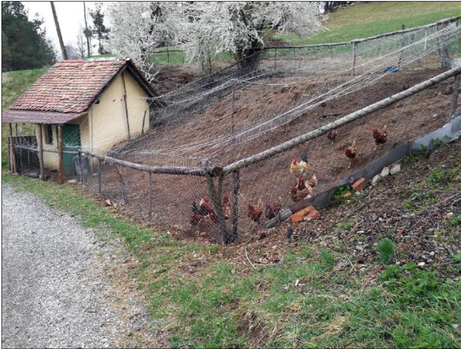
Slika 6: Mihelčičev dom na Govejku