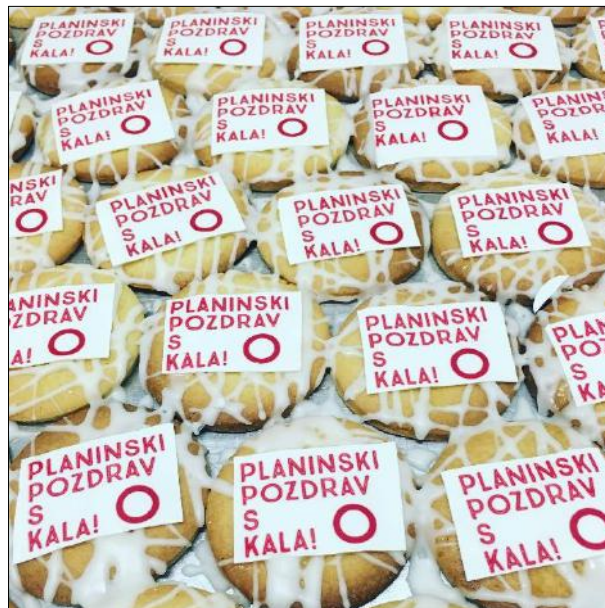
Slika 4: Planinski dom na Kalu