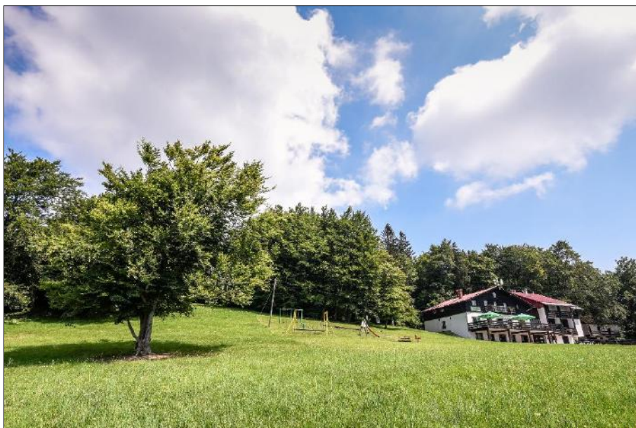
Slika 2: Planinski dom na Kalu