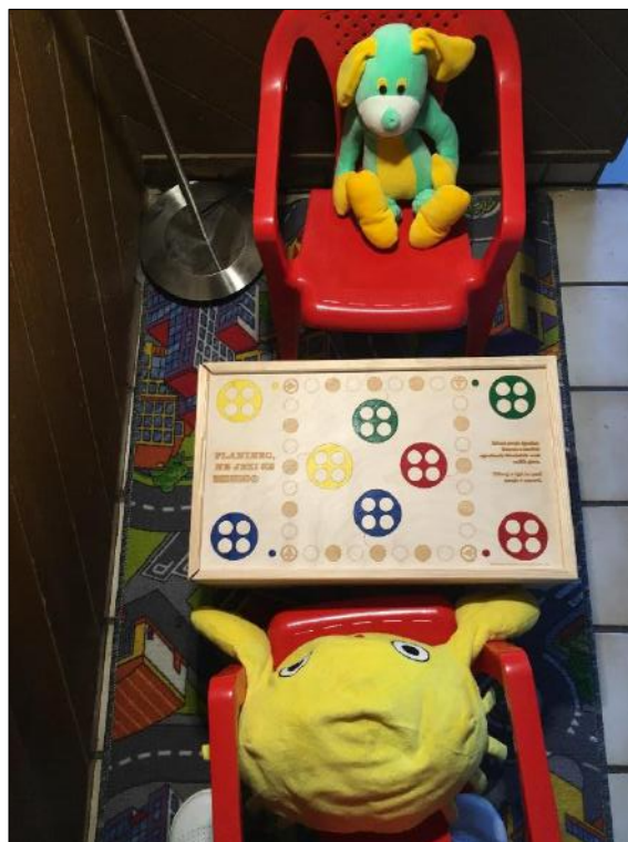
Slika 8: Planinski dom na Kalu

Pred kočjo je prostor z otroškimi igrali, planota pred domom pa sama po sebi ponuja velik prostor za najrazličnejše aktivnosti na prostem, postavljena sta tudi dva gola za nogomet. Za deževne dni je v koči urejen igralni kotiček, lahko si izposodite družabne igre.