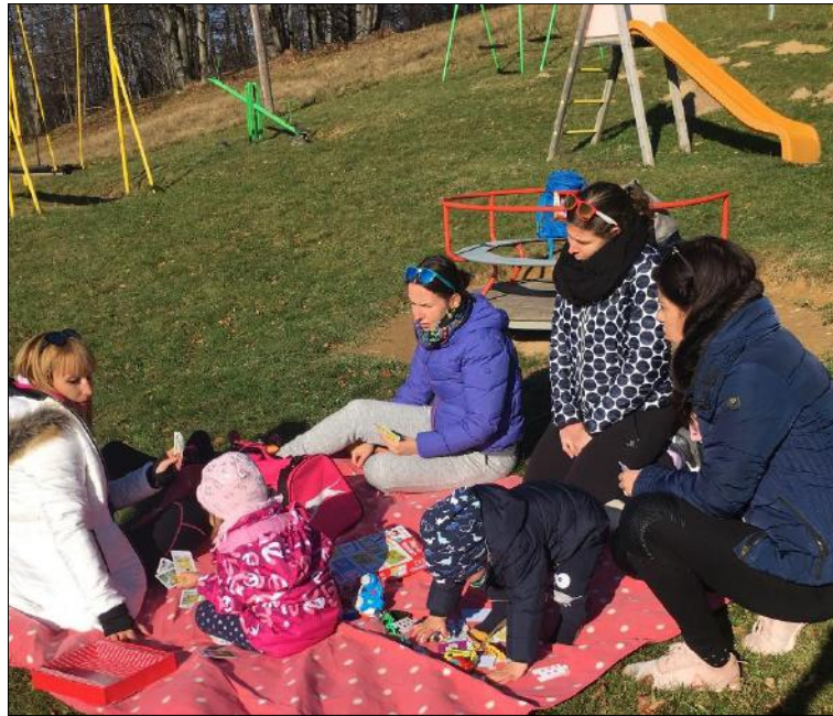
Slika 5: Planinski dom na Kalu

Planinski dom na Kalu: Planinsko kočo oskrbuje mlad par, kočar pa je last planinskega društva Hrastnik. Še posebej se trudijo, da bi bili na Kalu otroci dobrodošli ter bi tukaj začutili veselje do igre v naravi ter hoje v hribe. Planinski dom je lahko dostopen (prav do doma vodi asfaltirana cesta), kar pomeni, da je primeren tudi za najmlajše obiskovalce. Dom je odlična izhodiščna točka ali vmesna postaja za kolesarje in planince iz Zasavja ter Savinjske doline. V domu nudijo ugodnosti za družine, prenočitev za otroke do 5. leta starosti je brezplačna, otroci do 12. leta pa koristijo 50 % polne cene prenočišča. Večkrat na leto organizirajo večje dogodke, na katerih imajo napihljiva igrala in glasbo.