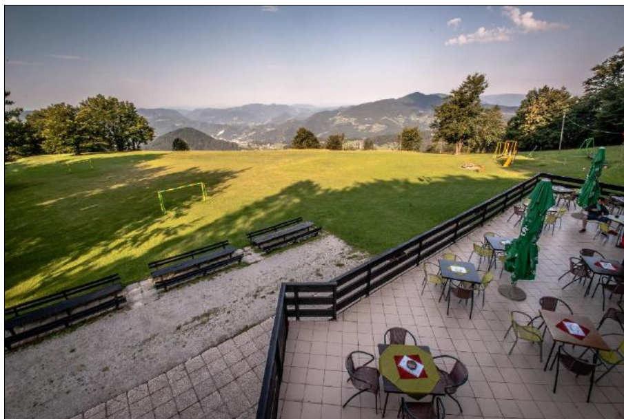
Slika 9: planinski dom na Kalu