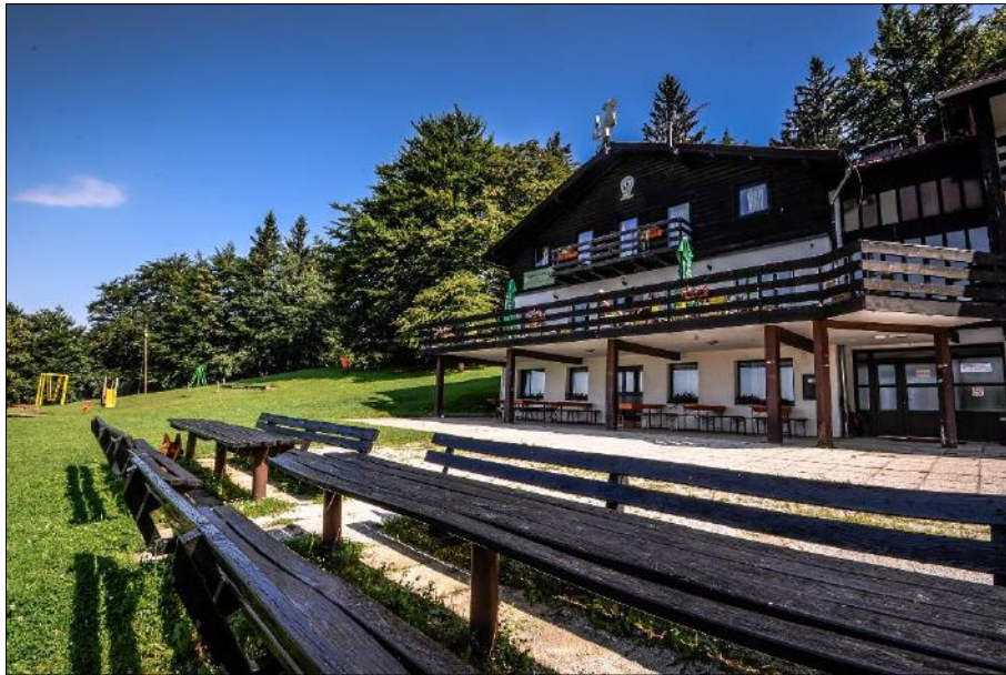
Slika 3: Planinski doma na kalu