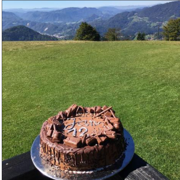
Slika 7: Planinski dom na Kalu

Pri njih je možno organizirati otroške rojstnodnevne zabave, pripravijo vam prostor, pogostitev ter rojstnodnevno torto.