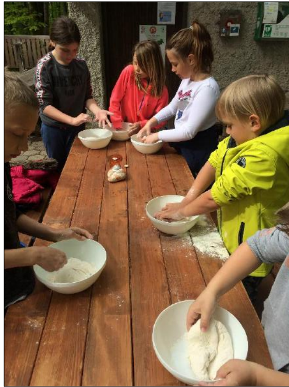
Slika 7: vir Koča na Planini nad Vrhniko