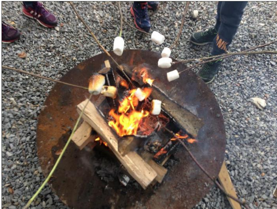
Slika 5: vir Koča na Planini nad Vrhniko

Dostop je lahek, poti so urejene in zato primerne tudi za najmlajše otroke. Poleti bodo na koči organizirali pustolovske počitnice za otroke (v soorganizaciji s podjetjem Veselje 17). Na 5-dnevnem taboru bodo otroci odkrivali naravo, preživljali večere ob tabornem ognju, spali v planinski koči. Od 24. 6. do 30. 8. bo razpisanih 10 terminov.