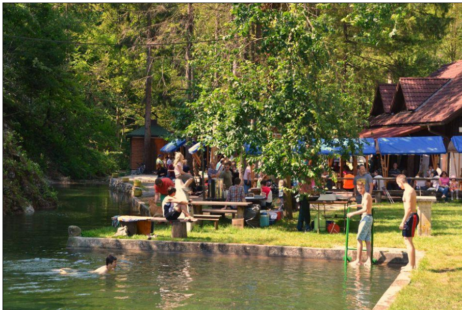
Slika 2: Star maln