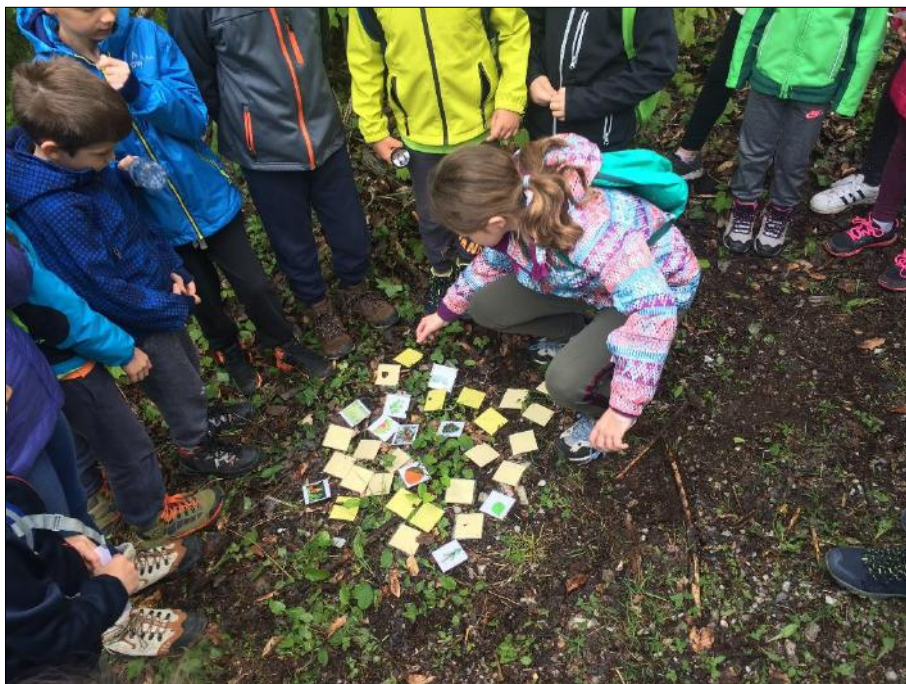
Slika 6: vir Koča na Planini nad Vrhniko

Občasno na koči pripravijo tudi različne delavnice (ustvarjalne, kuharske, športno-raziskovalne), ki se zvrstijo čez celo leto (praznični december, marca materinski dan, junija delavnice v okviru argonavtskih dni ...).