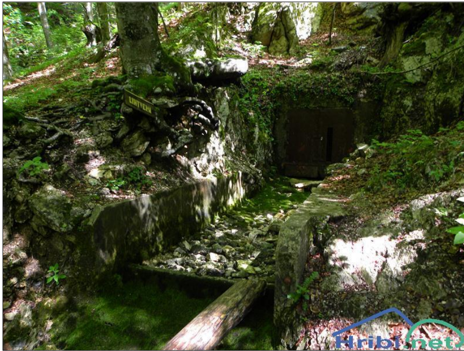
Slika 3: Lintvern