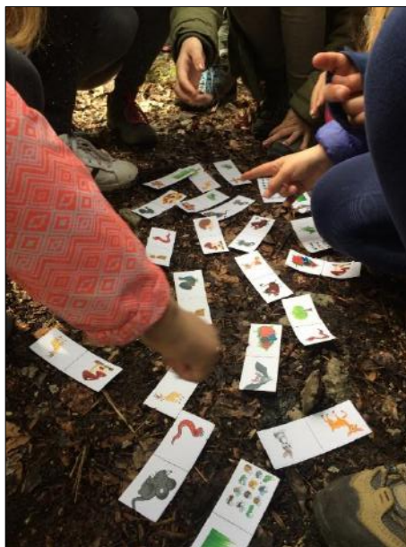
Slika 4: vir Koča na Planini nad Vrhniko

Osebjem koči si želi, da bi bil obisk koče prijetno in nepozabno doživetje za najmlajše planince in njihove starše, zato se trudijo, da sprejmejo družine z vso pozornostjo in se prilagodijo njihovim potrebam. Opremljenost koče je prilagojena otrokom, na voljo so otroški stolčki, previjalna miza, podstavki, varovala, igralni kotiček. Nudijo prilagojene otroške obroke. Okolica koče omogoča nemoteno aktivnost otrok, občasno organizirajo različne animacije (npr. Gozdna pustolovščina).