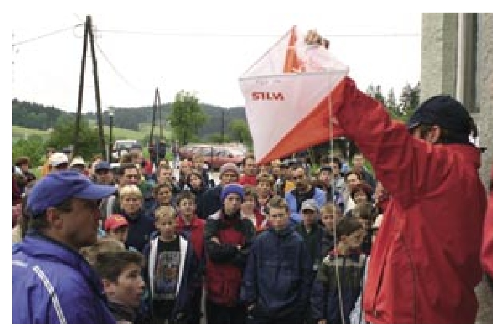
Pred začetkom orientacijskega tekmovanja

V vsej zgodovini planinskih orientacijskih tekmovanj pa se je bolj ali manj pojavljal problem, čemu dati več poudarka: času na progi (pri tem se pokaže fizična pripravljenost tekmovalcev) ali dodatnim planinskim vsebinam, kot so preizkusi praktičnega znanja orientacije, prve pomoči, vozlov ipd. (pri tem se pokaže znanje). Ker dolgo ni bilo enotnih meril, so se orientacijska tekmovanja v planin-