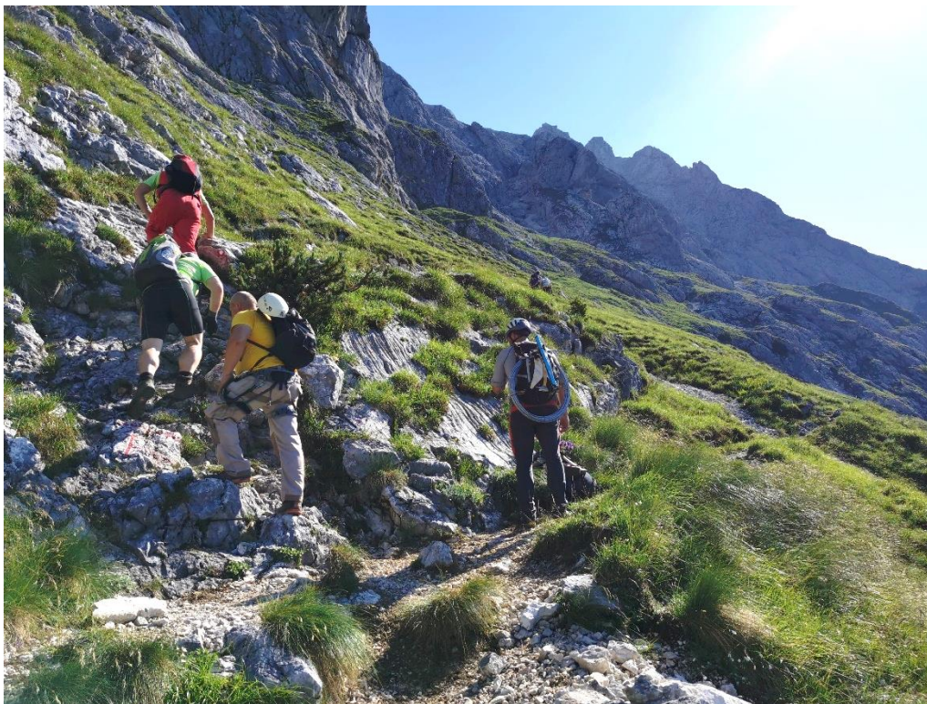
Na poti na delovišče - Jubilejna na Prisank, (foto: Matjaž Sušnik)

Komisija za planinske poti je strokovni organ PZS, določen v Statutu PZS, ki usmerja, usklajuje in pospešuje dejavnosti na področju planinskih poti. Deluje po določilih Pravilnika o delu KPP, Statuta PZS in Čistnega kodeksa slovenskih planincev ter ZPlanP.