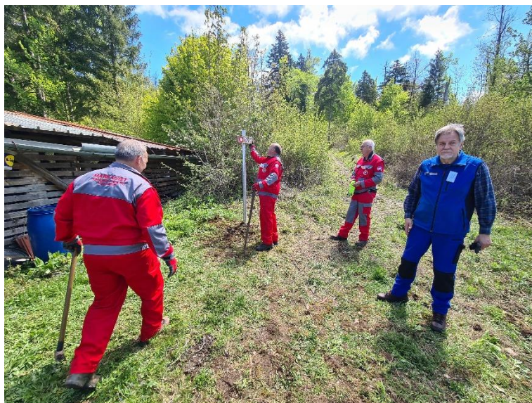
Tečaj A – Verd (postavitve droga in preverjanje ob primerni razdalji zaradi Covida)

Odbor za usposabljanje pripravlja strokovno literaturo ter druge strokovne pripomočke, organizira tečaje, seminarje, predavanja ter druge oblike izobraževanj in usposabljanj za markaciste. Usposabljanja za markaciste so se v 2021 zaradi omejitev povezanih s covid-19 prilagajala izvedb, številom udeležencev ter preverjanjem PCT pogojev, ki so se ves čas spreminjali. Kljub različnim izvedbam in kombinacijami terenskega dela in spletnih predavanj, pa so vsa usposabljanja izvedla vse teme po programu. Spomladi 2021 je bil tako izveden prilagojen tečaj za markaciste kategorije A, ki je bil preložen z 2020. Ostali tečaji so se odvili po predvidenem programu, razen tečaj B, kjer so bila zadnja predavanja izvedena januarja 2022 preko spleta. Izvedena so bila tudi vsa predvidena usposabljanja za obnovitev licence.