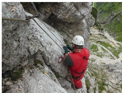
Vgradnja jeklenice na poti prek Plemenic