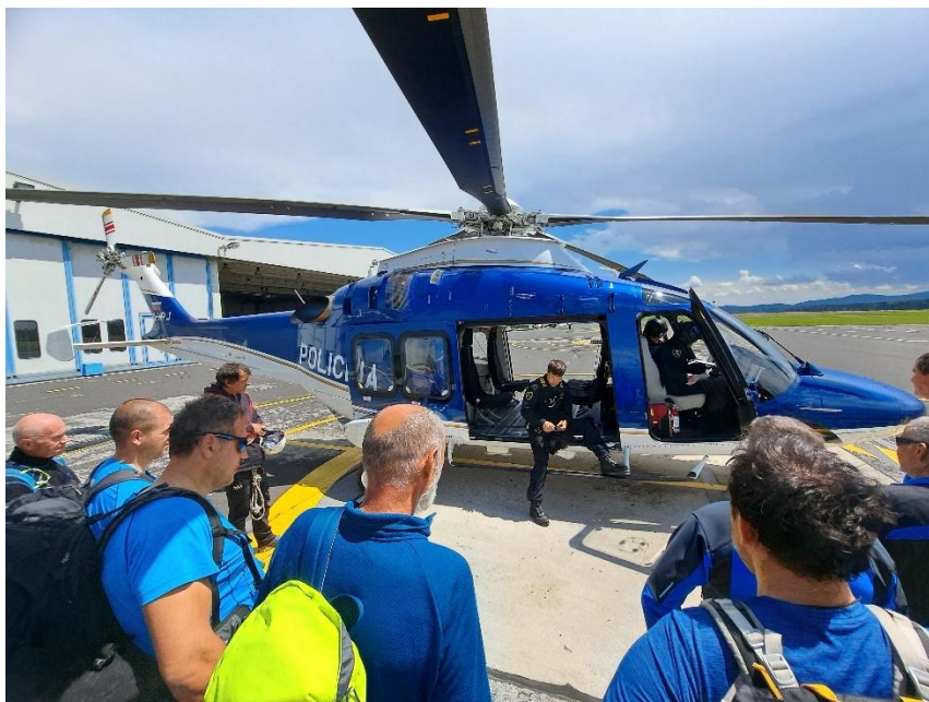
(foto: Alojz Pirnat - Usposabljanje kategorije C pri letalski enoti Policije na Brniku 2024)

Odbor za usposabljanje pripravlja strokovno literaturo ter druge strokovne pripomočke, organizira tečaje, seminarje, predavanja ter druge oblike izobraževanj in usposabljanj za markaciste. Vsa usposabljanja markacistov so bila tudi tokrat izvedena brezplačno. Žal je prišlo pri večini usposabljanj do kar velikega števila odjav tik pred izvedbo. Izvedena so bila vsa usposabljanja v skladu s planom za leto 2024. Zaradi velikega zanimanja se je izvedlo tudi dodatni tečaj za markaciste kategorije A in B ter usposabljanje markacistov za kategorijo C. V letu 2024 je pripravništvo za kategorijo B zaključilo 15 markacistov, pripravništvo za kategorijo C pa 5 markacistov.