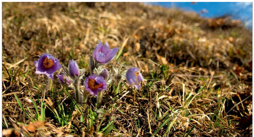
V Boletini pri Ponikvi je največje rastišče velikonočnice v Sloveniji