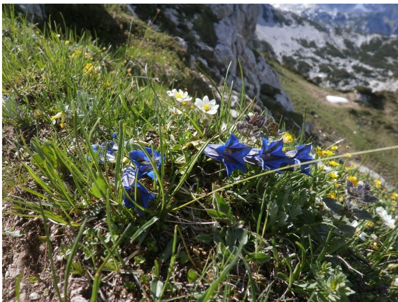
Slika 5: Alpsko cvetje na grebenu pod Viševnikom

Tu zelen dol in breg, tu cvetje že budi se, tu ptičji spev glasi se, gore še krije sneg,- zakaj nazaj? Nazaj v planinski raj!