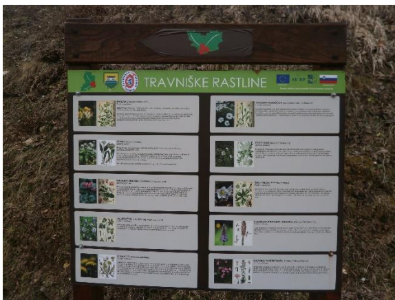
Slika 3: Primer informacijske table na učni poti okoli Reške planine

so tovrstni izleti dobra ideja za promocijo, predvsem pa ozaveščanje o biotski (v tem primeru predvsem rastlinski) raznovrstnosti na Slovenskem. V mesecu maju bi imeli priložnost spoznati rastišče Clusijevega svišča, o ogroženosti katerega so nedavno pred našo sejo poročali tudi vsi pomembnejši slovenski mediji. Dodatno me je k temu napeljal izlet na Reško planino nad Preboldom, ki sem se ga udeležil čisto zasebno in na katerem sem brez, da bi vedel vnaprej, hodil tudi po učni poti okoli Reške planine z nadvse zanimivimi informacijami o rastlinstvu, živalstvu, kamninski sestavi in še marsičem drugem na območju te gore. Seveda je Reška planina s tem že postala »vroč kandidat« za naslednji naravovarstveni pohod. Izrazil sem namreč željo, da bi PD vsako leto organiziralo vsaj en tovrsten izlet in poskušalo privabiti nanj čim več ljudi. Borut Cerkvanič se je ob tem ponudil, da mi bo pripravil in posredoval seznam potencialnih krajev in vrhov v Sloveniji, ki bi bili še posebej zanimivi za izvedbo naravovarstvenih izletov. V tem času sem dobil že nekaj namigov, od Kop na Pohorju do Donačke gore in celo Slavnika. Brez dvoma lokacij in poti tako pri nas kot onkraj naših državnih meja ne manjka. In čeprav je izlet na Lovrenc zaradi slabega vremena nazadnje odpadel, mi/nam to ni vzelo volje in poguma, da vztrajamo in uresničimo to idejo. Če ne letos, pa prihodnje leto.