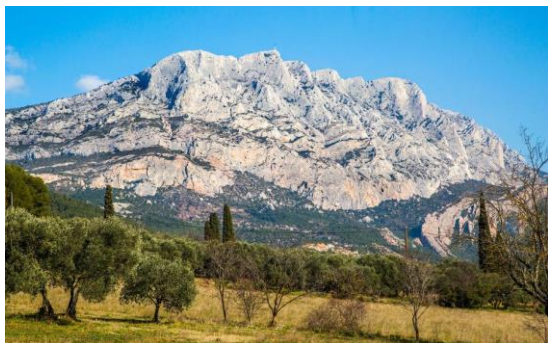
Slika 1: Gorski greben Montagne Sainte-Victoire

Francoski slikar Paul Cézanne je poleg številnih drugih slik zaslovel tudi s serijo upodobitev Montagne Sainte-Victoire, gorskega grebena v Provansi, v neposredni bližini francoskih Alp. Tam je nekaj časa tudi živel in tako skozi okno svoje hiše vsak dan opazoval častitljivi masiv, ki ga je očaral in mu dal navdih za ustvarjanje. S tem, ko jo je ovekovečil, je umetnik gori izkazal visoko mero spoštovanja in naklonjenosti.