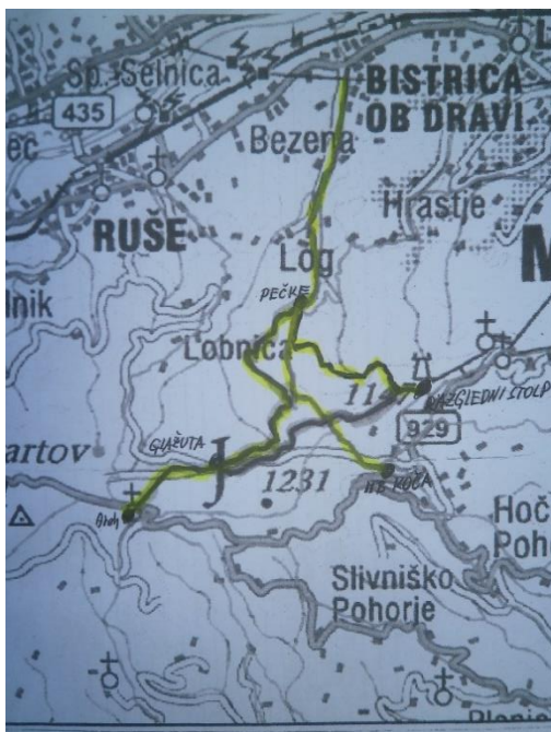
Slika 2: Planinske poti, ki jih vzdržuje PD Drava Maribor (označene z rumeno)