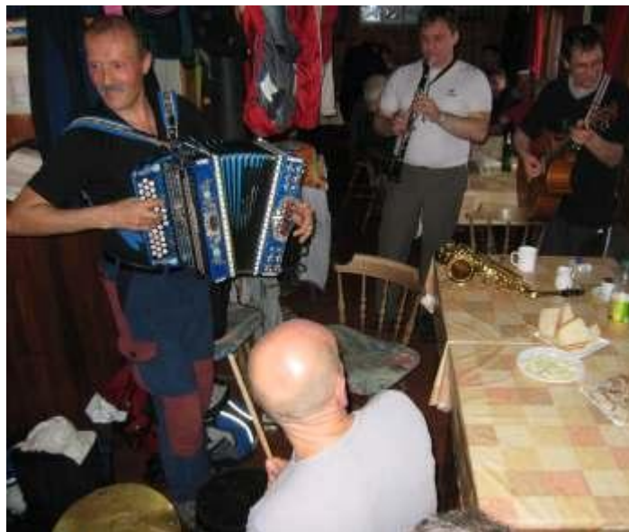
Slika 4: naključna slika zabave Kališču

Ni vrag, kjer je družba, je tudi glasno, če je harmonika pred kočo, je veselo in priznam, da mi je to všeč. Hkrati se sprašujem, ali je takšno vedenje za to okolje primerno. Ne, seveda ni primerno, saj je to živ-žav, ki moti živali, in to je ena izmed zadreg učenca Polža – rad imaš naravo, rad imaš glasbo, še raje oboje skupaj, rad imaš živali – kaj sedaj? Morda bi zabavo po osvojitvi vrha kazalo preseliti v dolino.