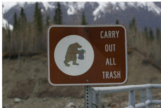
Slika 5: simpatično opozorilo (vir: http://www.alpari-life.ru/en/nacionalnyj-park-denali-vse-svoe-noshu-i-unoshu-s-soboj/ )

Ko hodimo po gorah in hribih, smo v pretežni meri kar zgledni, saj smeti res ne odmetavamo kar povprek, hkrati pa smo pozorni na kolege, da ravnajo enako. Žal se za raznimi grmiči, med skalnimi razpokami in jamami najdejo skrite »cvetke« nesnage in neodgovornega vedenja. Tudi pri prenovah koč se včasih zanemari naravovarstveni vidik na račun ekonomike in varčevanja.