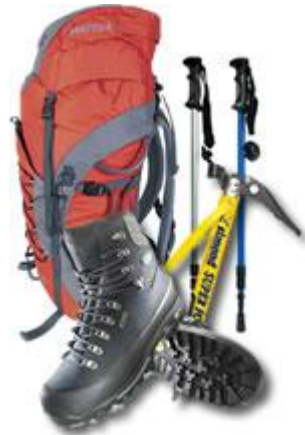
Slika 6: osnovna pohodniška oprema

bi se peljala do Kranja ali Ljubljane, kjer so specializirane trgovine za planince. Včasih je problem tudi v denarju, saj dobra oprema tudi zahteva svoj denar.