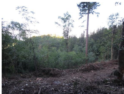
Poseke ob planinskih poteh

Številne gozdne poseke po Konjiški gori so kot grde rane v vegetacijskem plašču. Gozdarji sicer zagovarjajo poseke, saj naj bi se tako gozd hitreje in temeljiteje pomladil. Spravilo lesa je razumljivo treba opraviti, a kjer vleka lesa poteka po planinskih poteh, so te zlasti na razmočenem terenu večkrat povsem uničene.