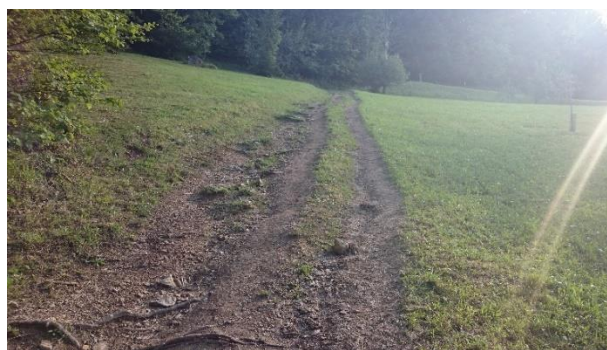
Iz ene poti kmalu nastanejo tri

Ker je erozijo poti lažje preprečevati kot sanirati, bi morali planincem fizično preprečiti uporabo bližnjic z namestitvijo naravnih ovir, npr. vej. Če je mogoče, naj bi bila taka ovira čim manj vpadljiva v okolju, a vseeno učinkovita. Začeli bi lahko tudi z opozorilnimi tablamami v primernem, slabo vest zbujujočem tonu, ki bi jih namestili na mesta, kjer pohodniki najpogosteje ubirajo bližnjice.