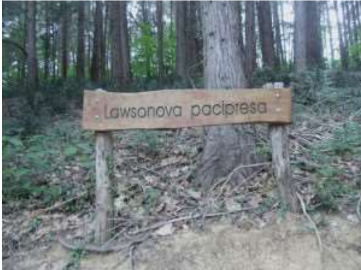
učna pot, oznaka Lawsonove paciprese

Je šesta odprta učna pot po vrsti v Sloveniji, narejena pa je bila leta 1981. Pot poteka na nadmorski višini od 50 do 140 metrov. Na poti pa spoznamo različne vrste dreves, nekatere od njih so tudi zaščitena vrsta. Podamo se lahko po krajši 1000 m dolgi poti, ali po daljši 1800 m dolgi poti.