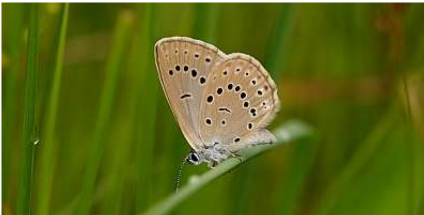
strašnič in mravljiščar

Za gozd Panovec je še posebna laška žaba. Je srednje velika žaba, njeno telo meri 7,5 cm. Živi predvsem v vlažnih listnatih gozdovih, ob potokih in stoječih vodah. Spada med najbolj ogrožene evropske dvoživke, zato je v Sloveniji zavarovana. Tu je njeno največje in najpomembnejše nahajališče v Sloveniji.