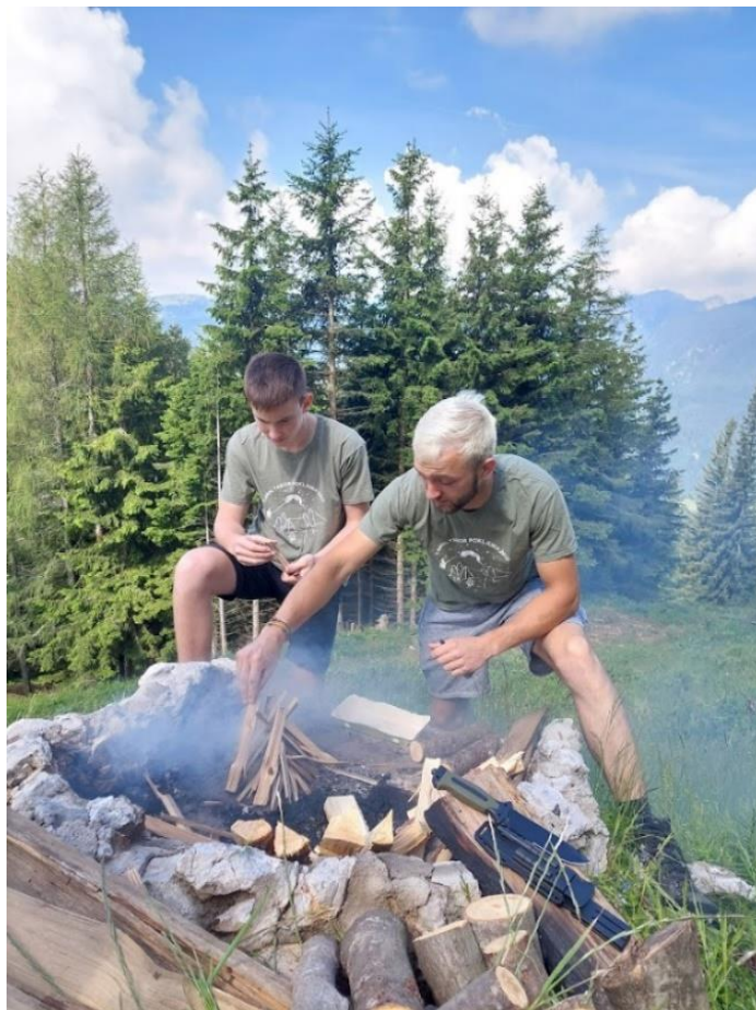
Slika 7: Priprava ognjišča