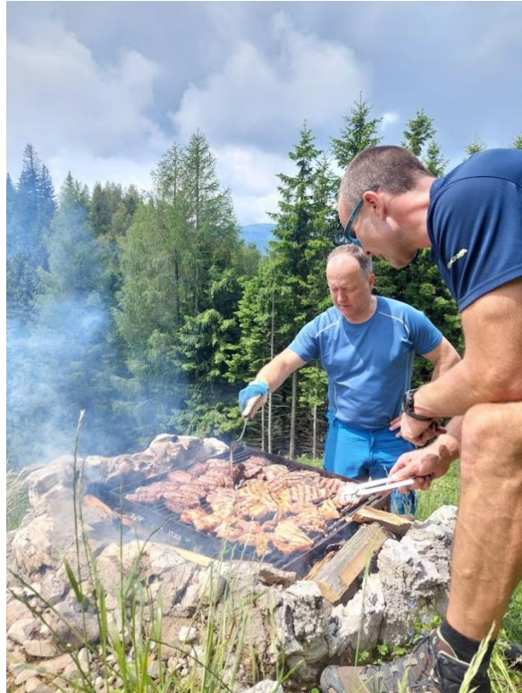
Slika 12: Priprava kosila

Potem smo se po drugi poti vrnili do bivaka in najprej pričeli s peko mesnih dobrot, potem pa še s peko palačink, ki so bile velik uspeh.