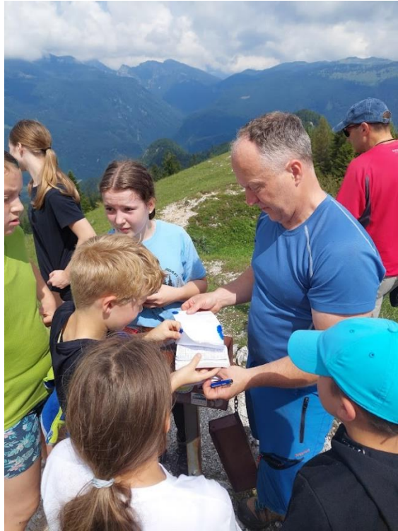
Slika 10: Vpisovanje v knjigo na vrhu Lepenatke

Na poti do vrha smo spoznavali različne živalske in rastlinske vrste – na Lepenatki uspeva tudi Kamniška murka, ki je eden od slovenskih endemitov. Na vrhu smo se vpisali v knjigo in uživali v razgledih.