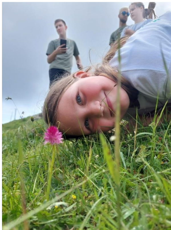
Slika 11: Zala opazuje Kamniško murko, enega od slovenskih endemitov

Na poti do vrha smo spoznavali različne živalske in rastlinske vrste – na Lepenatki uspeva tudi Kamniška murka, ki je eden od slovenskih endemitov. Na vrhu smo se vpisali v knjigo in uživali v razgledih.