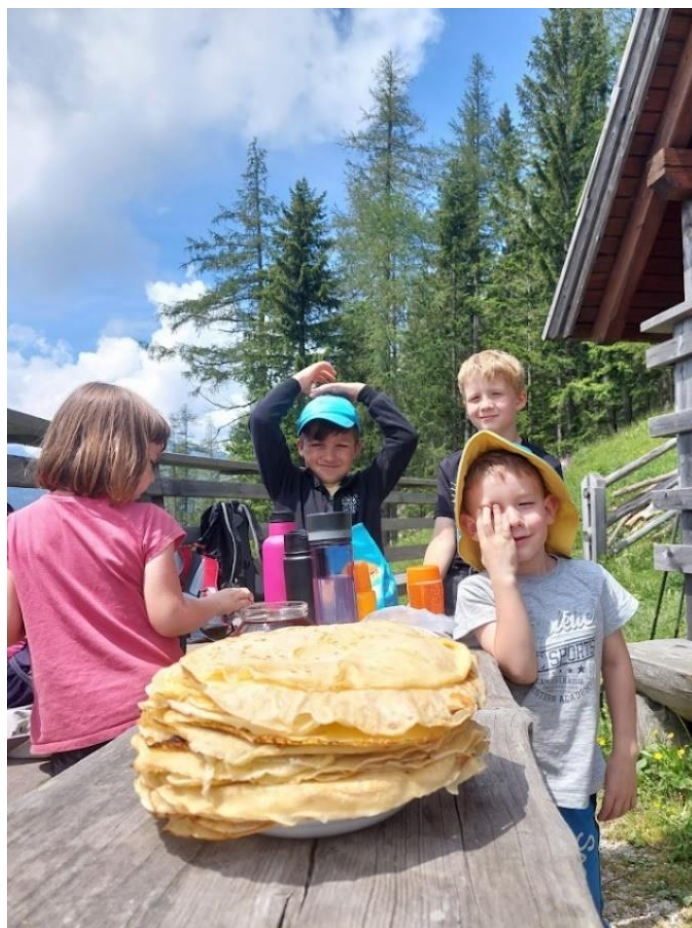
Slika 14: Palačinke

Po kosilu in peki palačink se je druženje zavleklo v popoldanske ure, potem smo bivak in okolico bivaka pospravili in ob 16.00 je sledil povratek v dolino. Na poti proti Gornjem Gradu smo obvestili starše, da so prišli iskat svoje otroke.