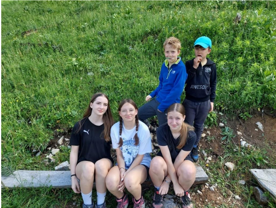
Slika 6: Udeleženci na klopi ob ognjišču