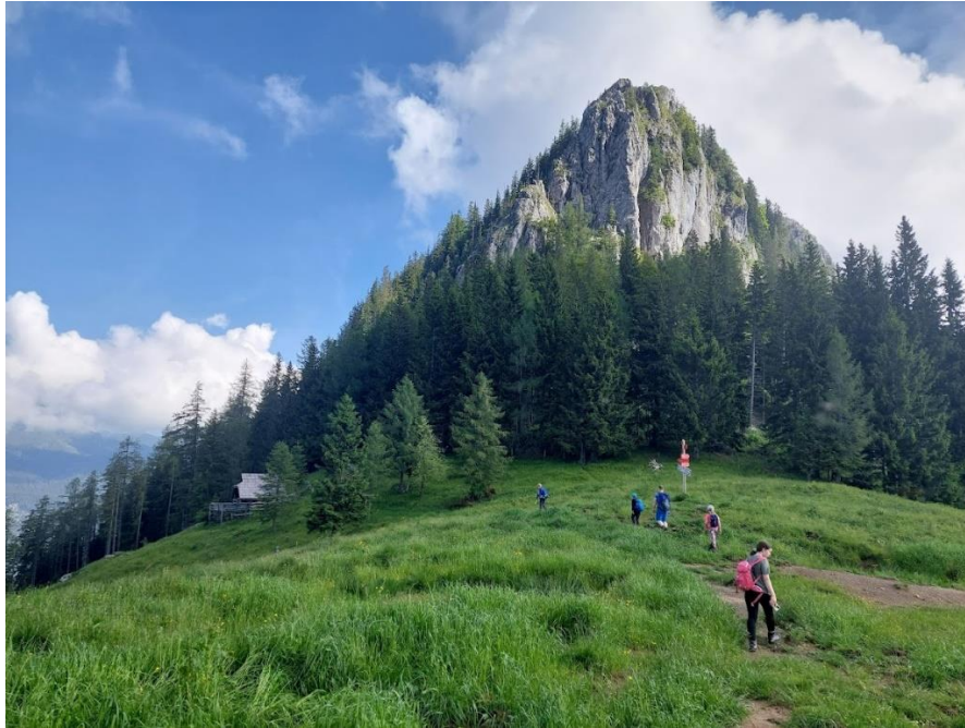
Slika 4: Prihod na Kal; v ozadju je Veliki Rogatec

V približno 45 minutah smo prišli do bivaka. Najprej smo pripravili ognjišče, zakurili ter naredili maso za palačinke. Otroci so pri vsem tem z veseljem pomagali – vsi so iskali les za kurjenje, nekatera dekleta pa so tudi pomagala pri pripravi mase.