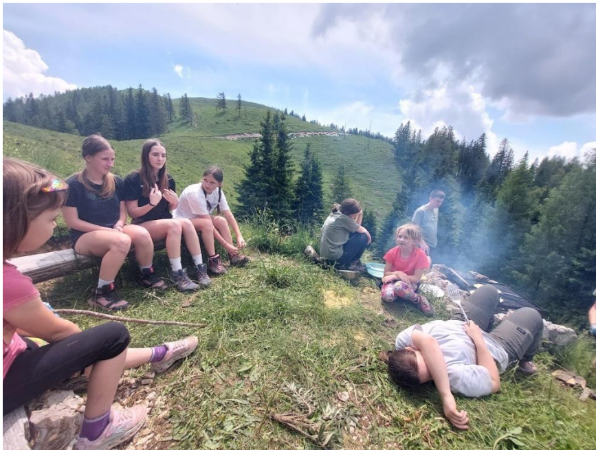
Slika 13: Čakanje na palačinke

Potem smo se po drugi poti vrnili do bivaka in najprej pričeli s peko mesnih dobrot, potem pa še s peko palačink, ki so bile velik uspeh.