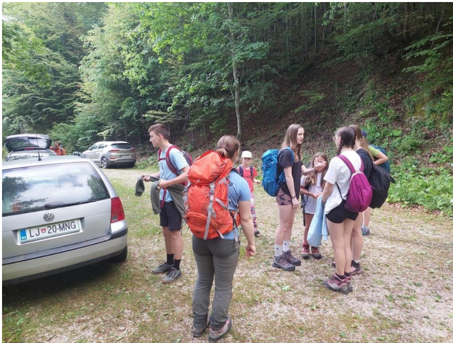
Slika 3: Izhodišče planinske poti v Lenartu

Z vsemi prijavljenimi udeleženci smo se ob 8.00 zbrali na avtobusni postaji v Gornjem Gradu. Tam smo si razdelili hrano in sestavine za palačinke. Potem smo se z avtomobili odpeljali do izhodišča v Lenartu.