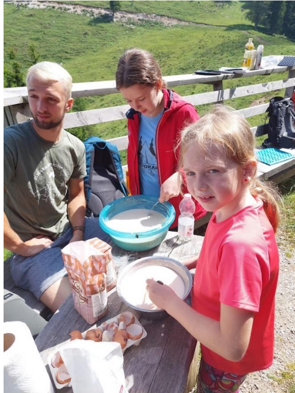
Slika 8: Priprava mase za palačinke

Tako smo poskrbeli, da bo kosilo hitro nared, ko se vrnemo še iz vrha Lepenatke, na katerega smo se odpravili takoj po uspešni pripravi ognjišča. Vzpon na Lepenatko je trajal še približno pol ure.