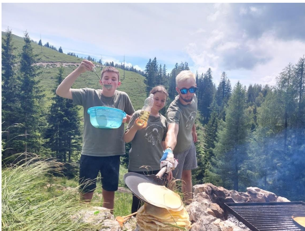
Slika 1: Peka palačink na zunanjem ognjišču

Odločila sem se za izvedbo dogodka z naslovom »Palačinke na Kalu«, kjer se osrednje dogajanje vrti okoli peke palačink na bivaku na Kalu pod Lepenatko. Želela sem si, da skupaj še z nekaterimi ostalimi člani našega mladinskega odseka in z udeleženci dobro izkoristimo eno sončno junijsko soboto, se malo sprehodimo, podružimo in osnovnošolce kaj novega naučimo ter jim pokažemo, da se lahko imajo zelo dobro tudi brez celodnevne tipkanja po telefonih.