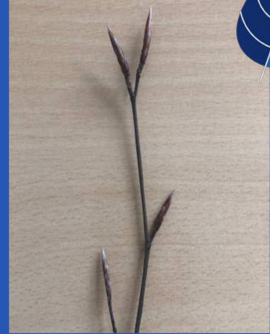
Dolgi, zašiljeni brsti