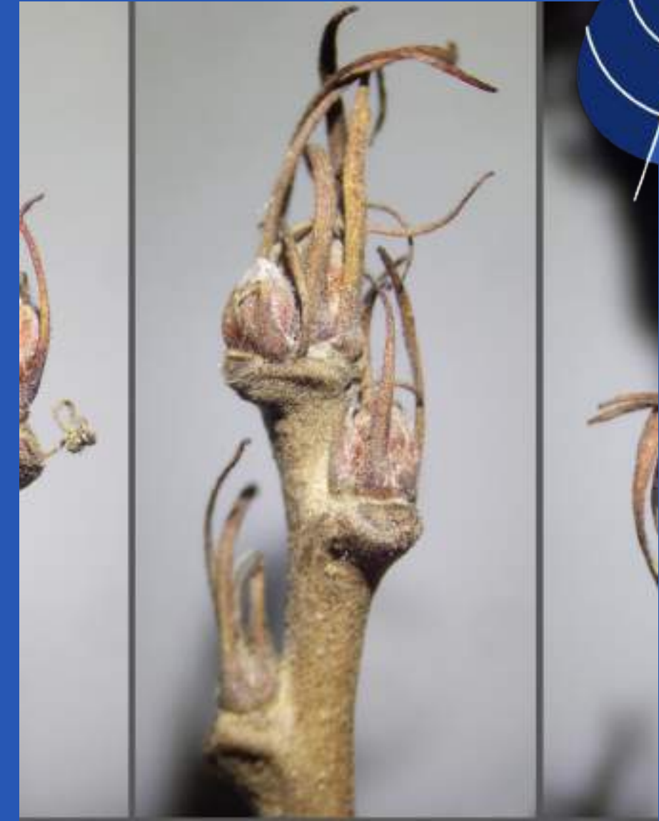
Brsti z značilnimi dolгими prilisti