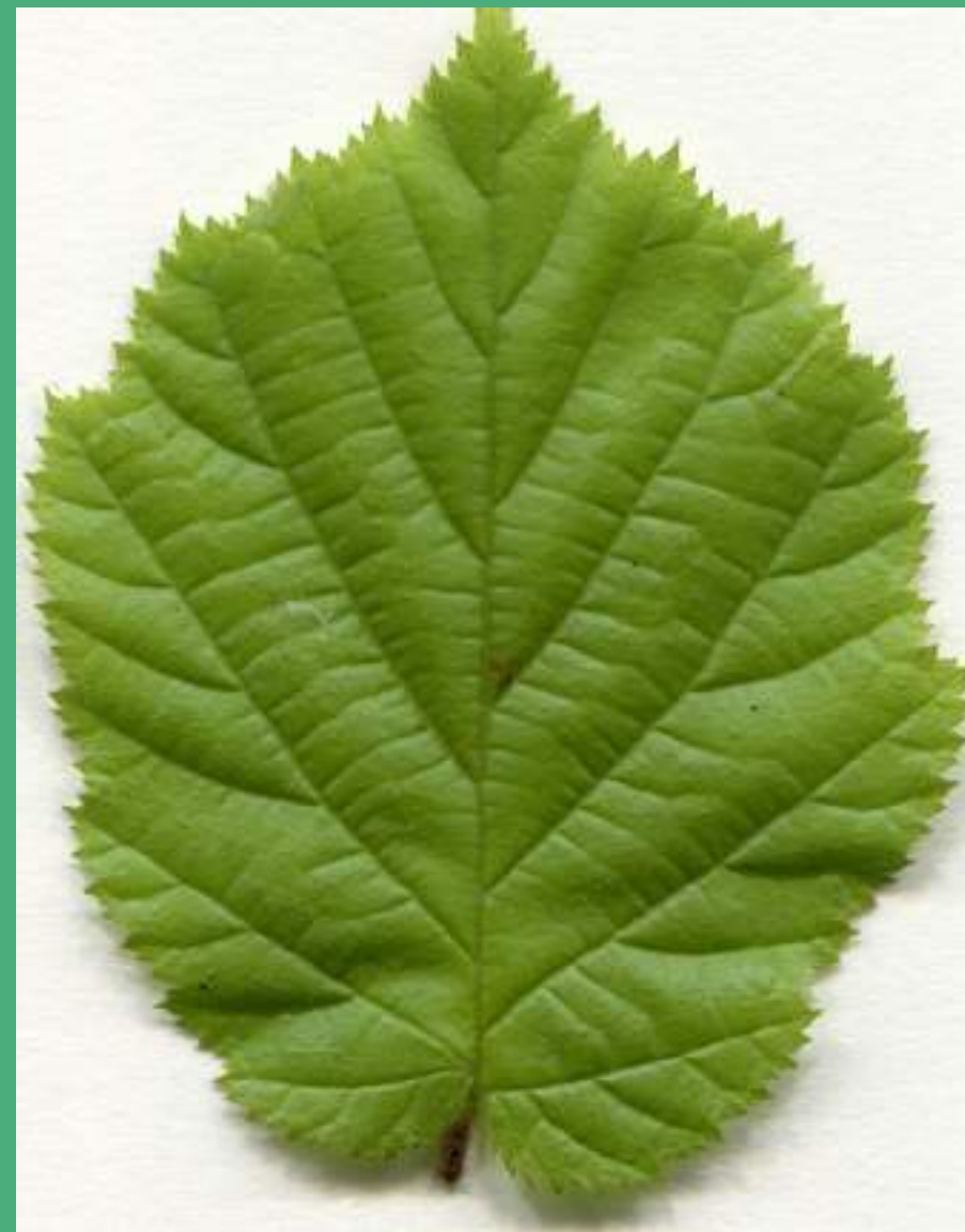
Okroglast list z nazobčanim robom