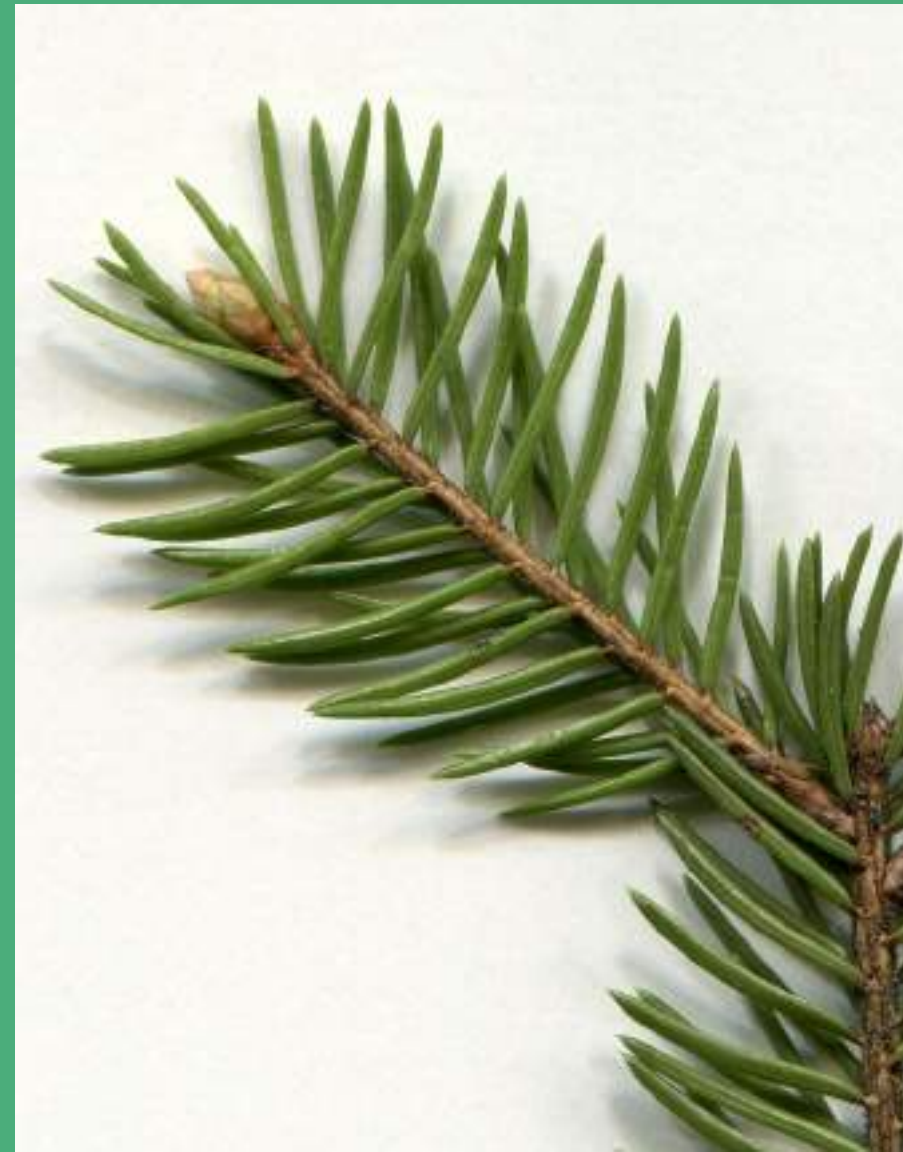
Rjavi nastavki na iglicah