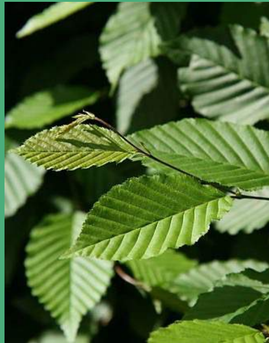
Nazobčan rob in vtisnjene žile na listu