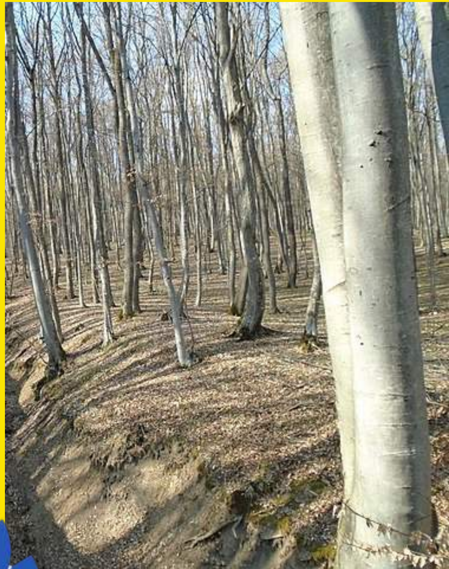
Gladko, sivo deblo