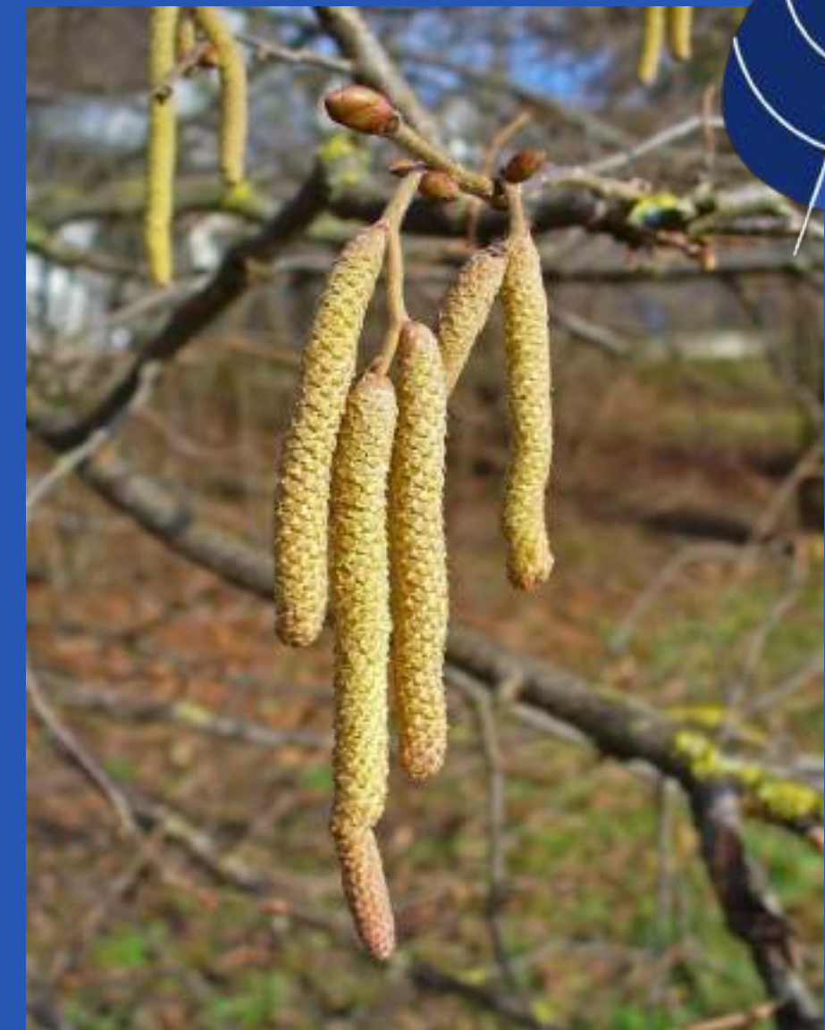
Brsti in mačice