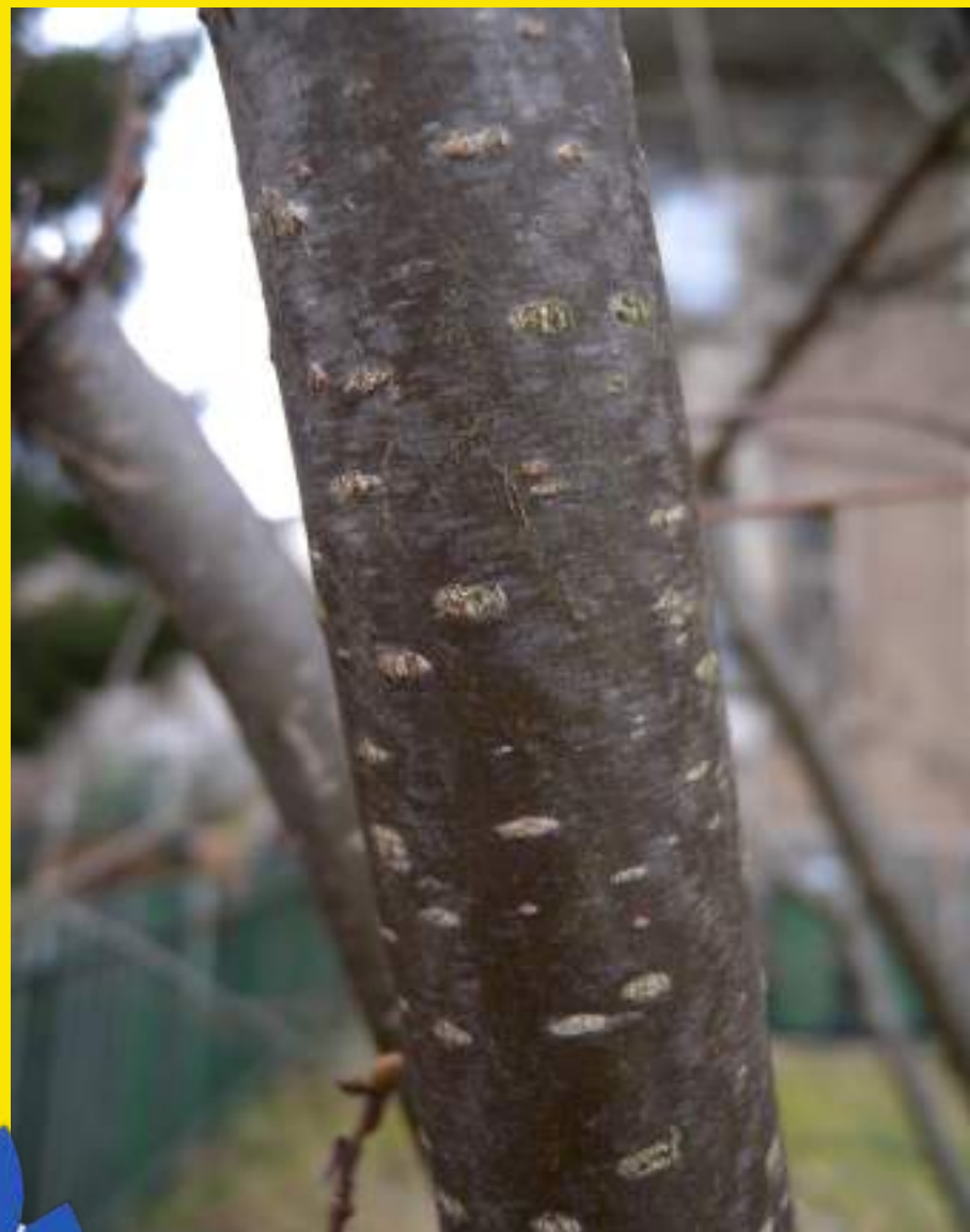
Siva in gladka skorja