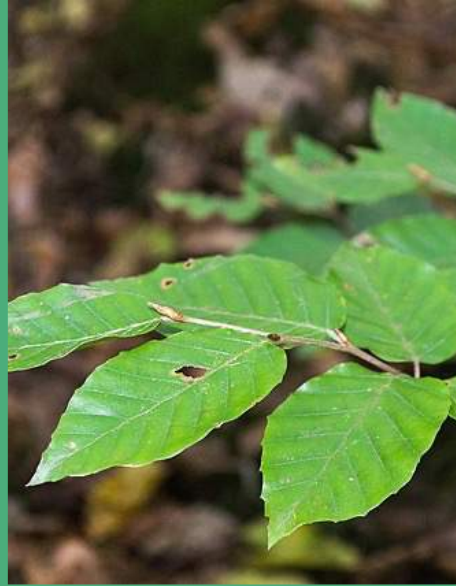
Eliptični listi z rahlo valovitim robom