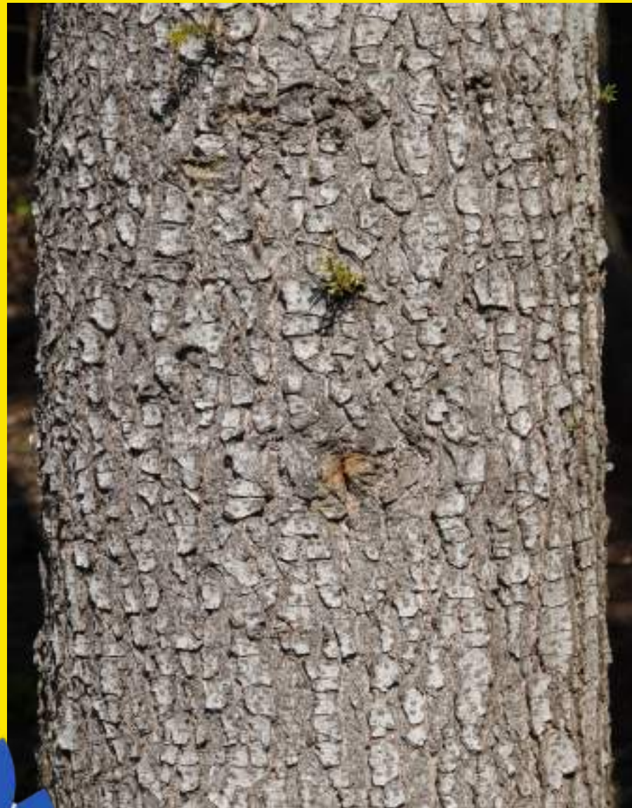
Pravokotne razpoke v skorji