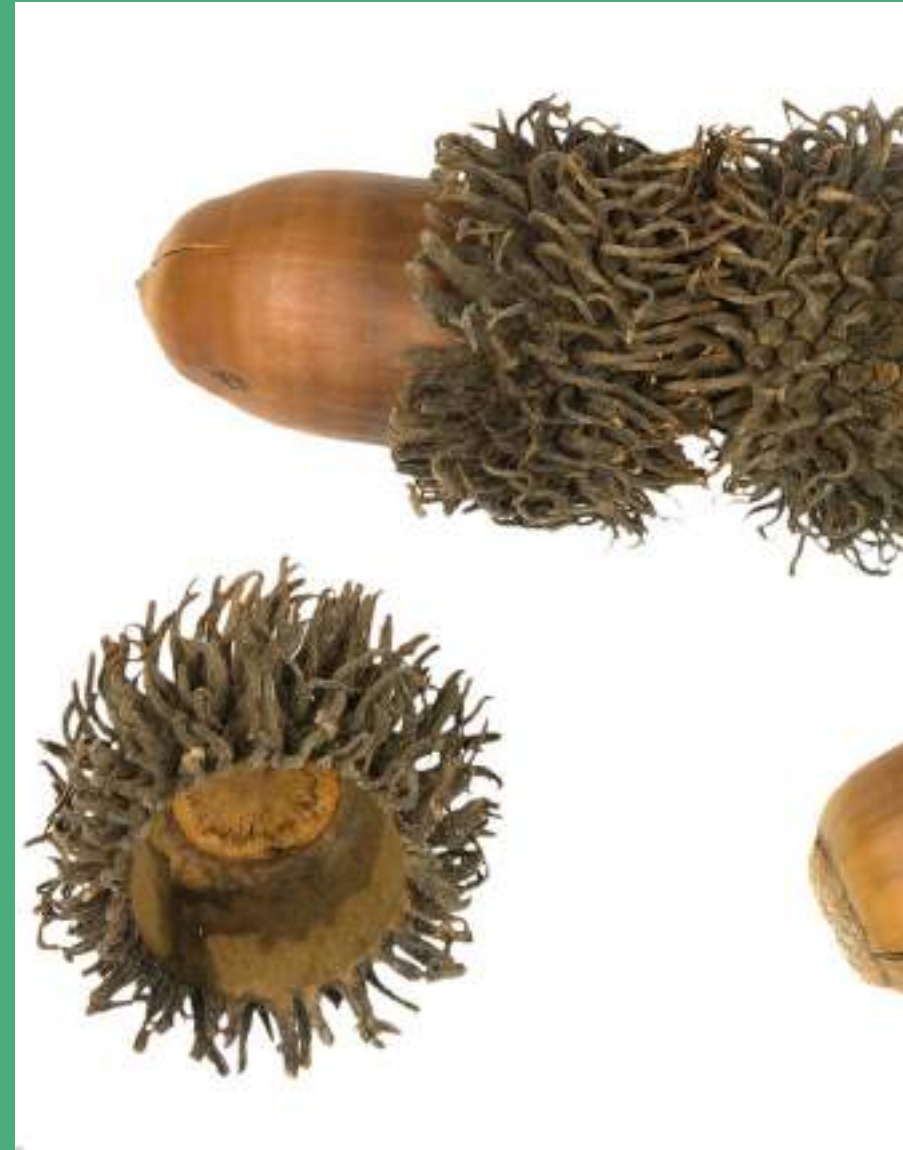
Izrastki na kapici želoda