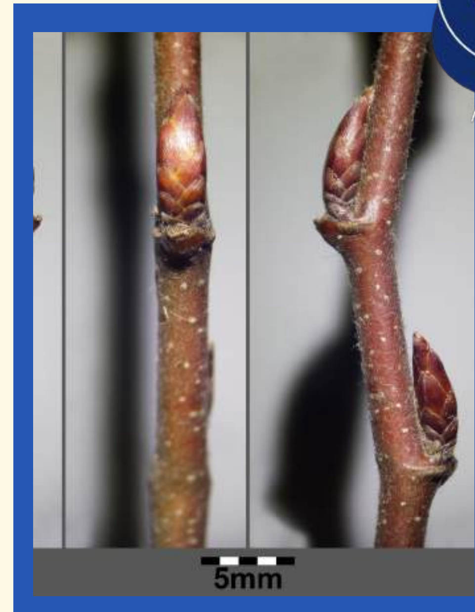
Dolgi, zašiljeni brsti