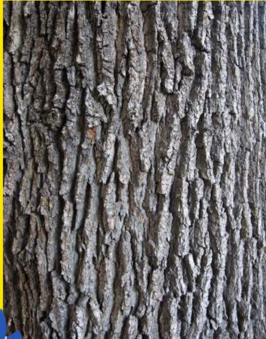
Plitvo razpokana siva skorja