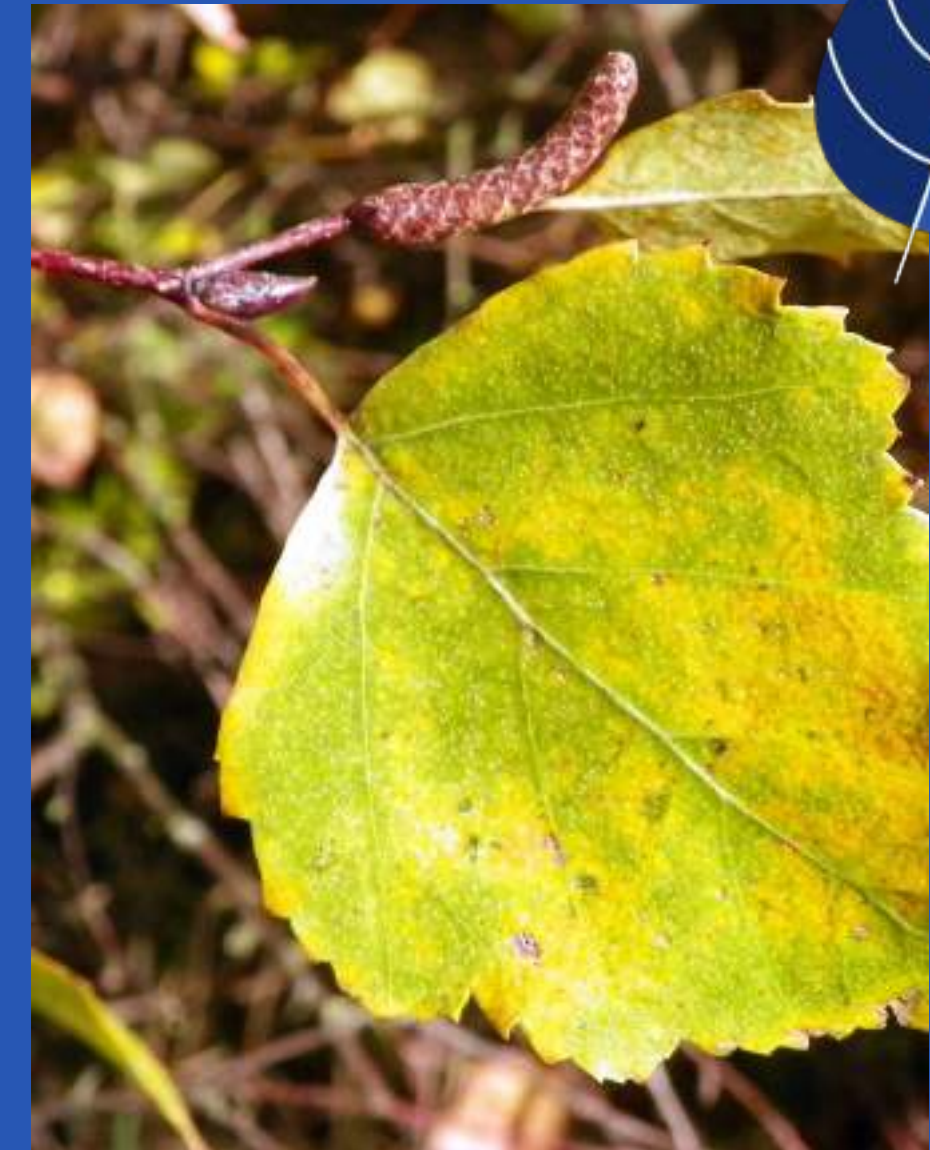
Brst, list in mačica