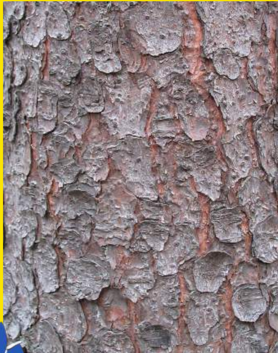
Okroglaste razpoke v skorji