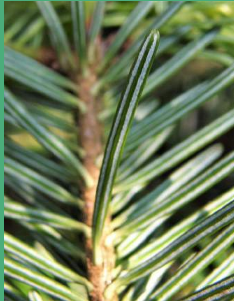
Dve beli progi na spodnji strani iglice