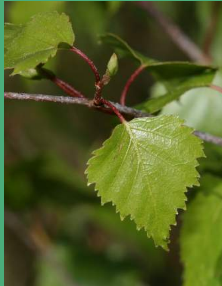
List rombaste oblike z nazobčanim robom