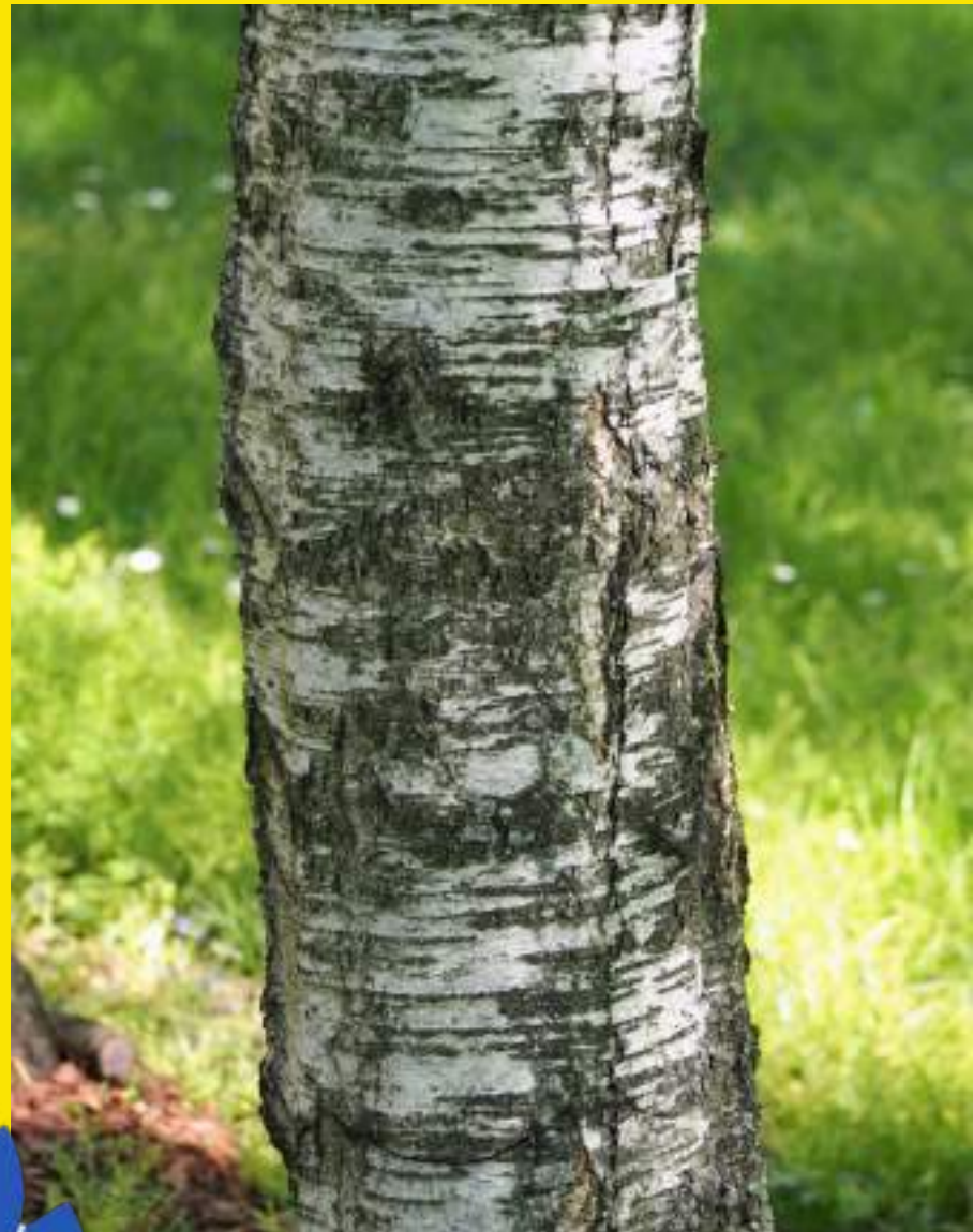
Značilna bela skorja