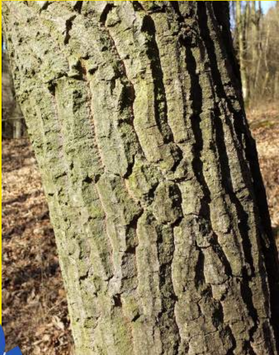
Značilna oranžna barva med razpokami