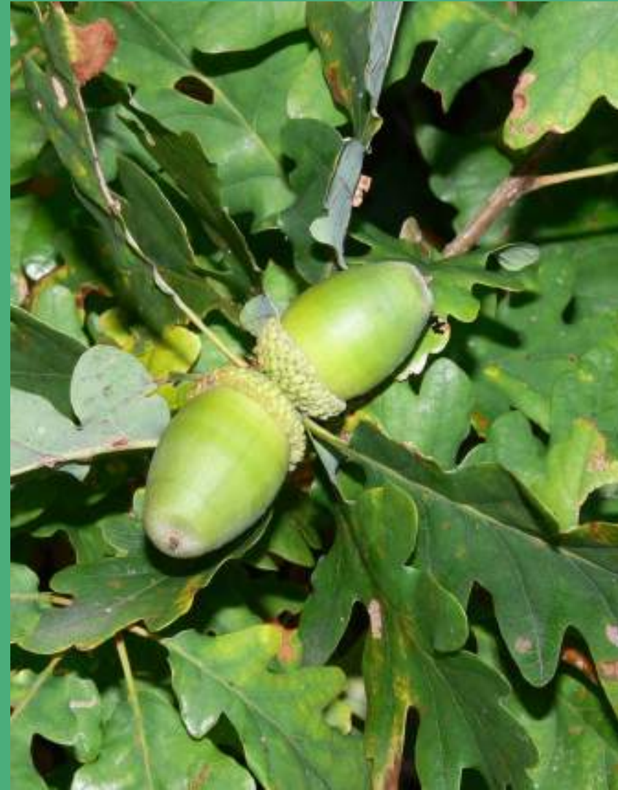
Želod z gladko kapico