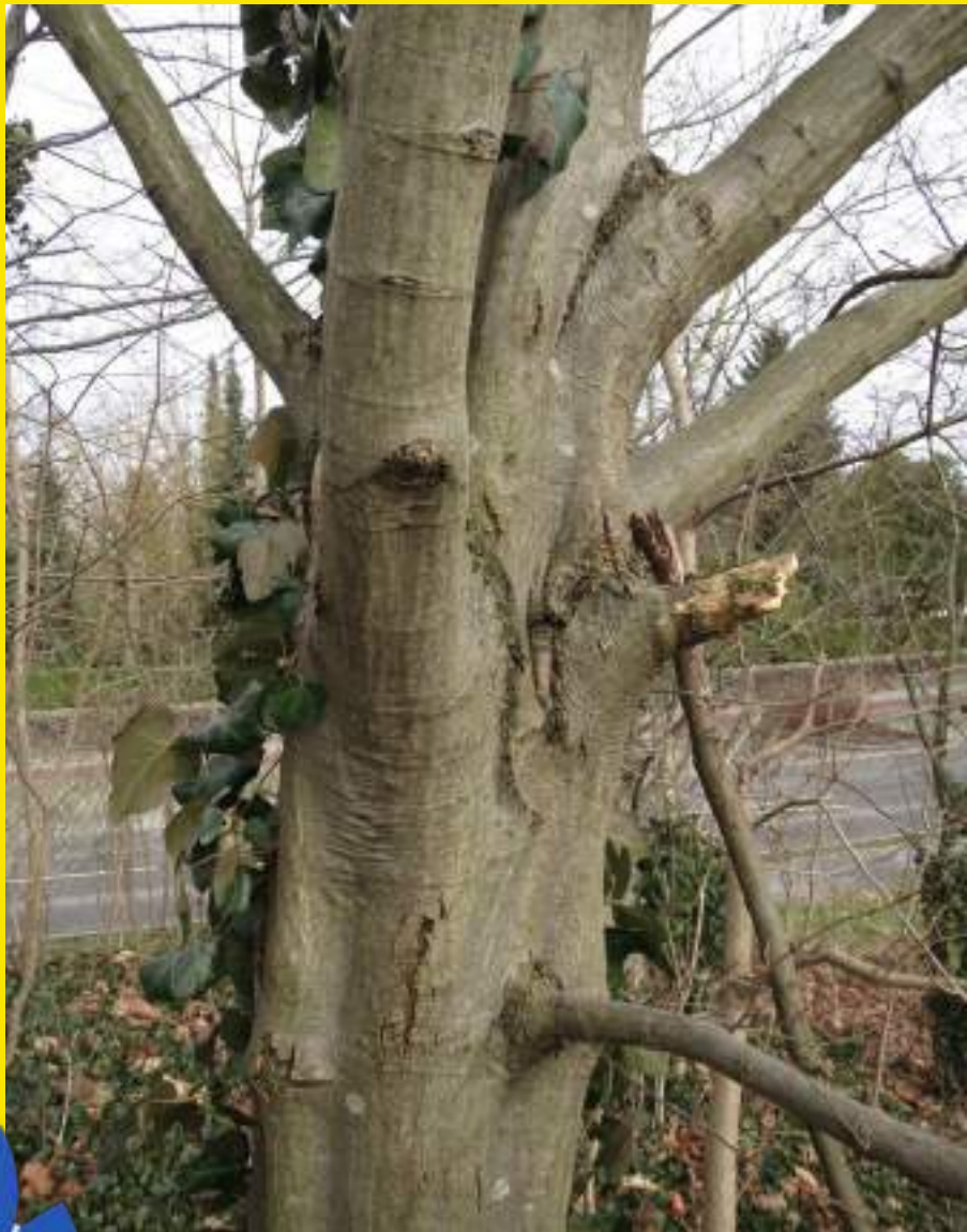
Rahlo razpokana skorja