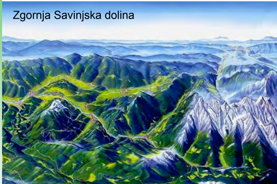
Zgornja Savinjska dolina

Stičišče treh dežel - Štajerske, Gorenjske in Koroške in dveh gorstev - Karavank in Kamniško-Savinjskih Alp