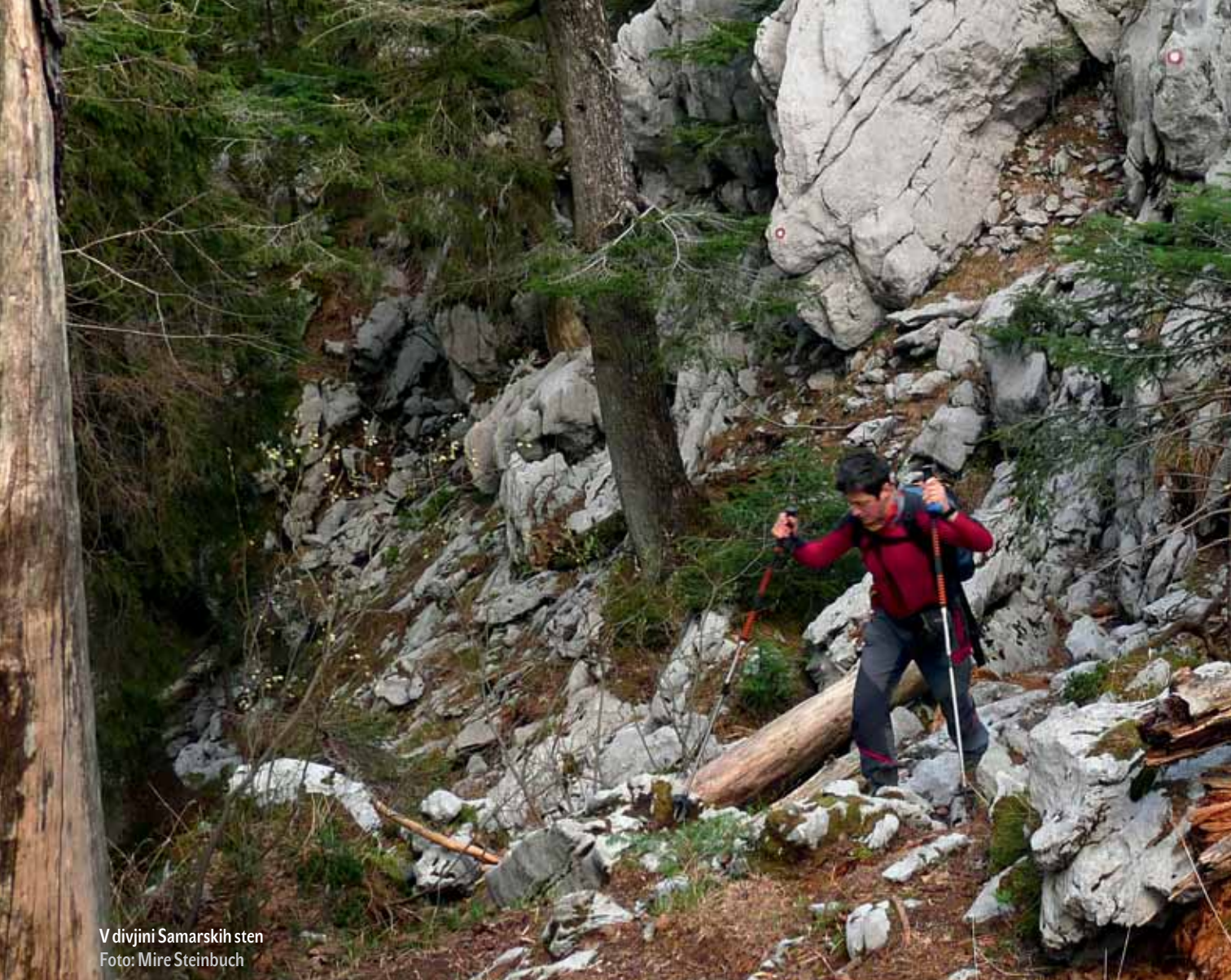
V divjini Samarskih sten