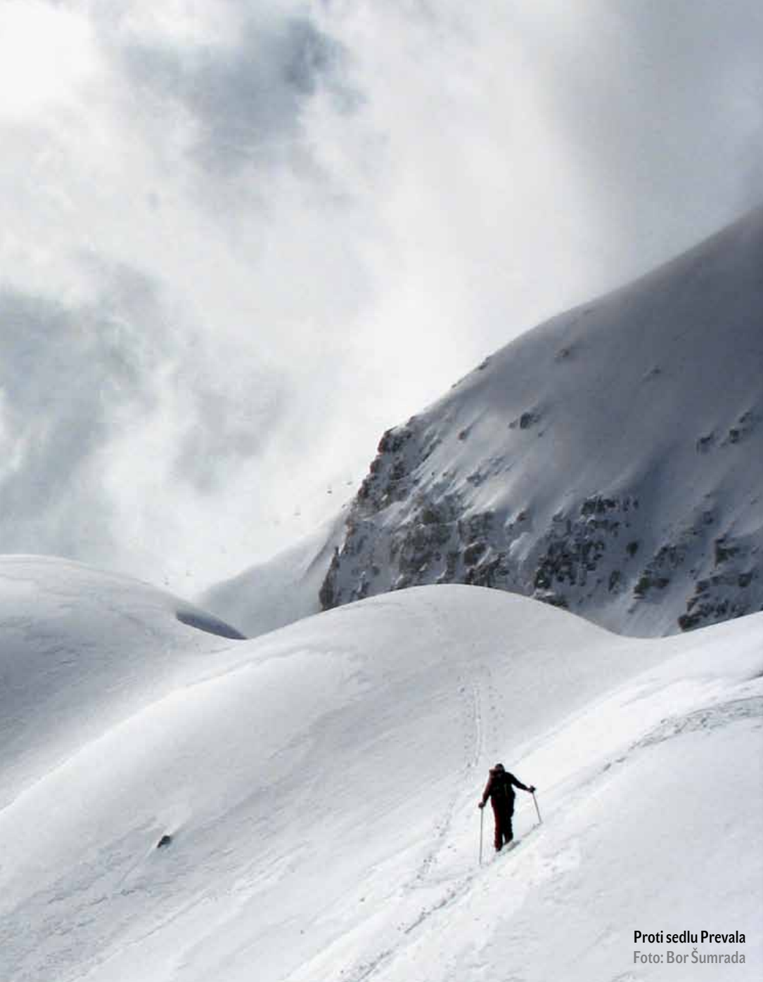
Proti sedlu Prevala

ZIMSKI POHOD 45 Iz Hotedršice v Žir Med zmrzaljo in soncem Rafael Terpin