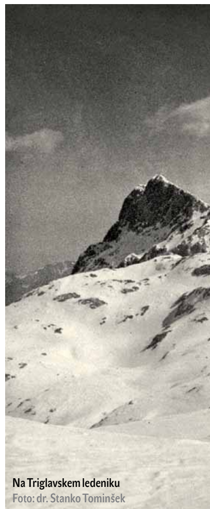
Na Triglavskem ledeniku