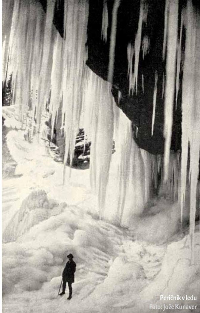
Peričnik v ledu