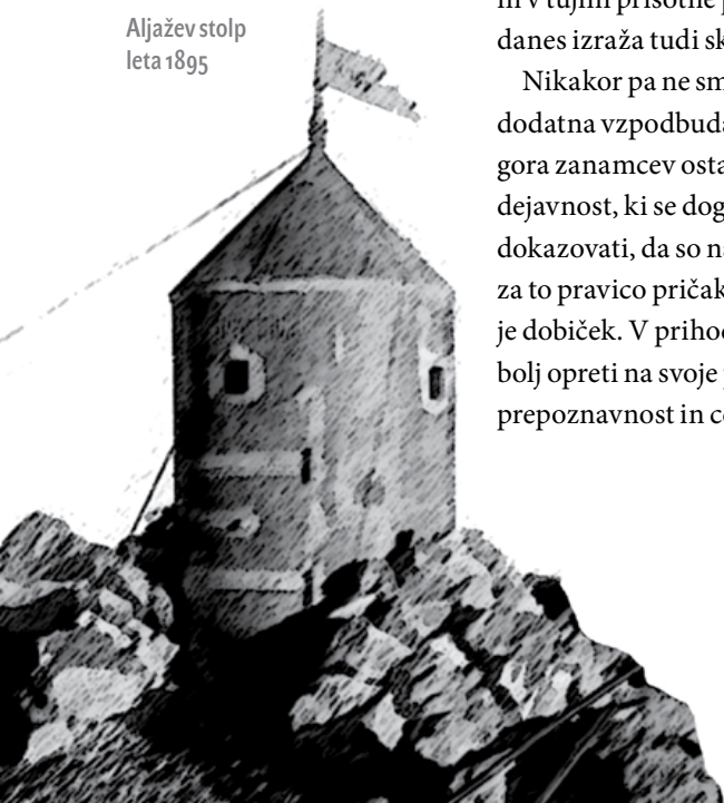
Aljažev stolp leta 1895