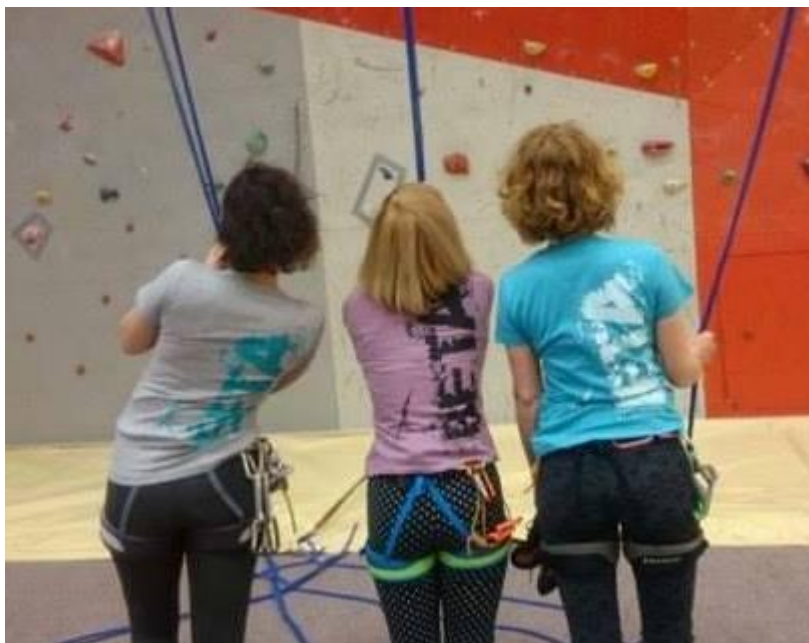
Slika 4: Plezanje v Črnem Kalu.