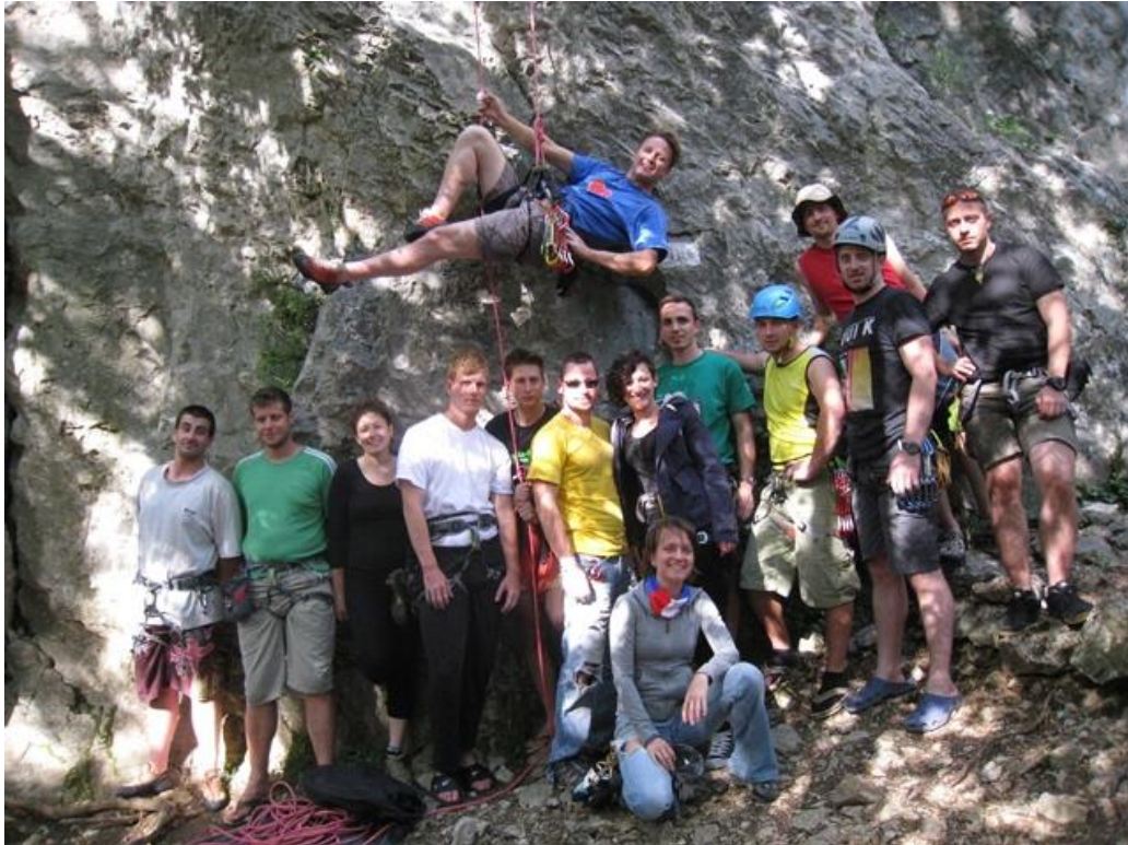
Slika 5: Zaključek mlajše skupine (Vransko).