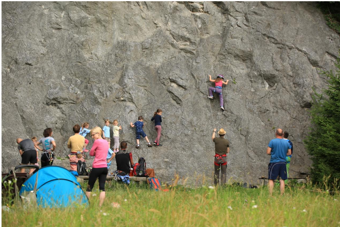
Slika 6: Plezanje v Omišu.