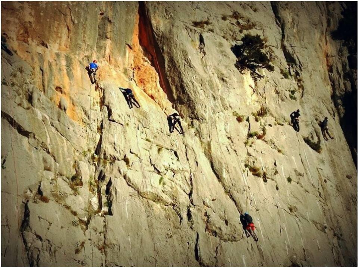
Slika 7: Tečajniki pri učenju.