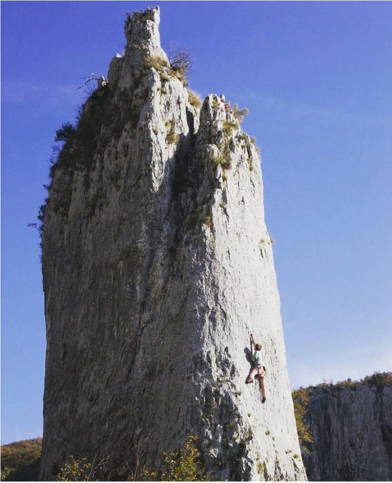
Slika 12: Plezalni festival Kotečnik