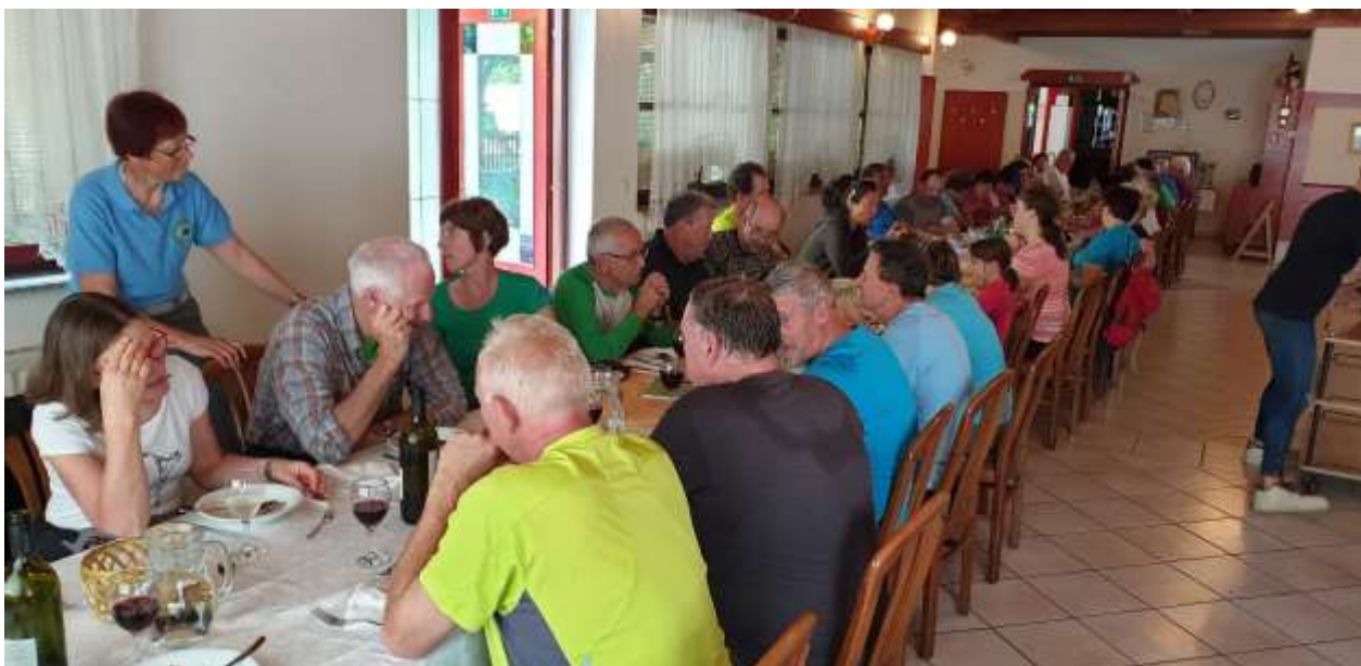
Zaključek 13. tečaja za GS po prehojeni Machovi učni poti, 6. 6. 2020