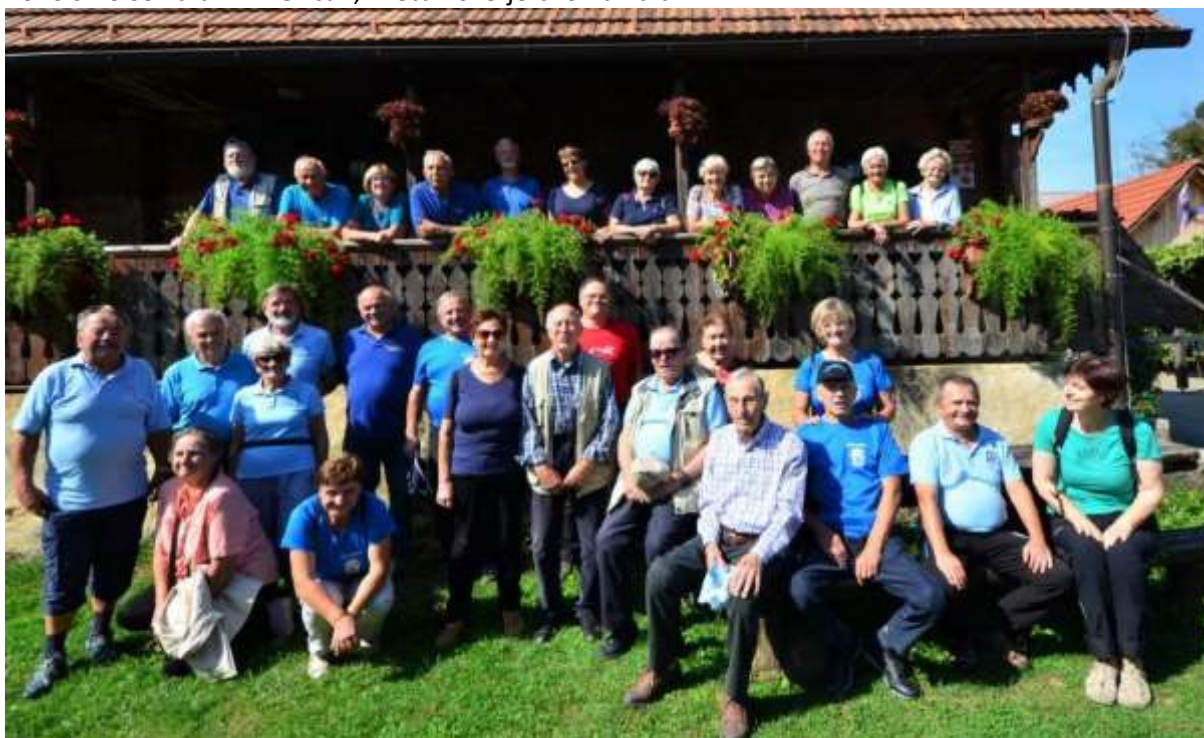
Slika 5, foto Vinko Šeško, srečanje starejših planincev pri Martinovih v Globočicah.

Starejšim planincem želimo podati posebno pozornost, zato se skupno srečamo enkrat letno. V letu 2020 smo se zbrali v Brežicah, v letu 2019 je bilo na Kalu.