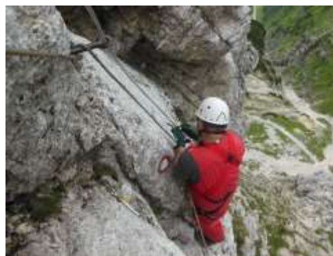
Vgradnja jeklenice na poti prek Plemenic