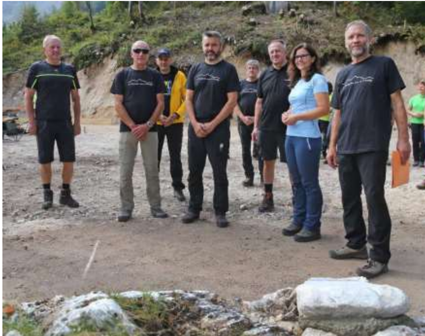
Položitev temeljnega kamna za nov Frischaufov dom na Okrešlju, Foto: Andraž Purg