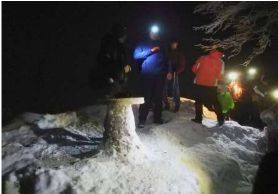
Utrinek z nočnega pohoda na Grmado

Skupni izlet z PD Medvode dne 10.6.2020 v počastitev obletnice postavitve smerne table.