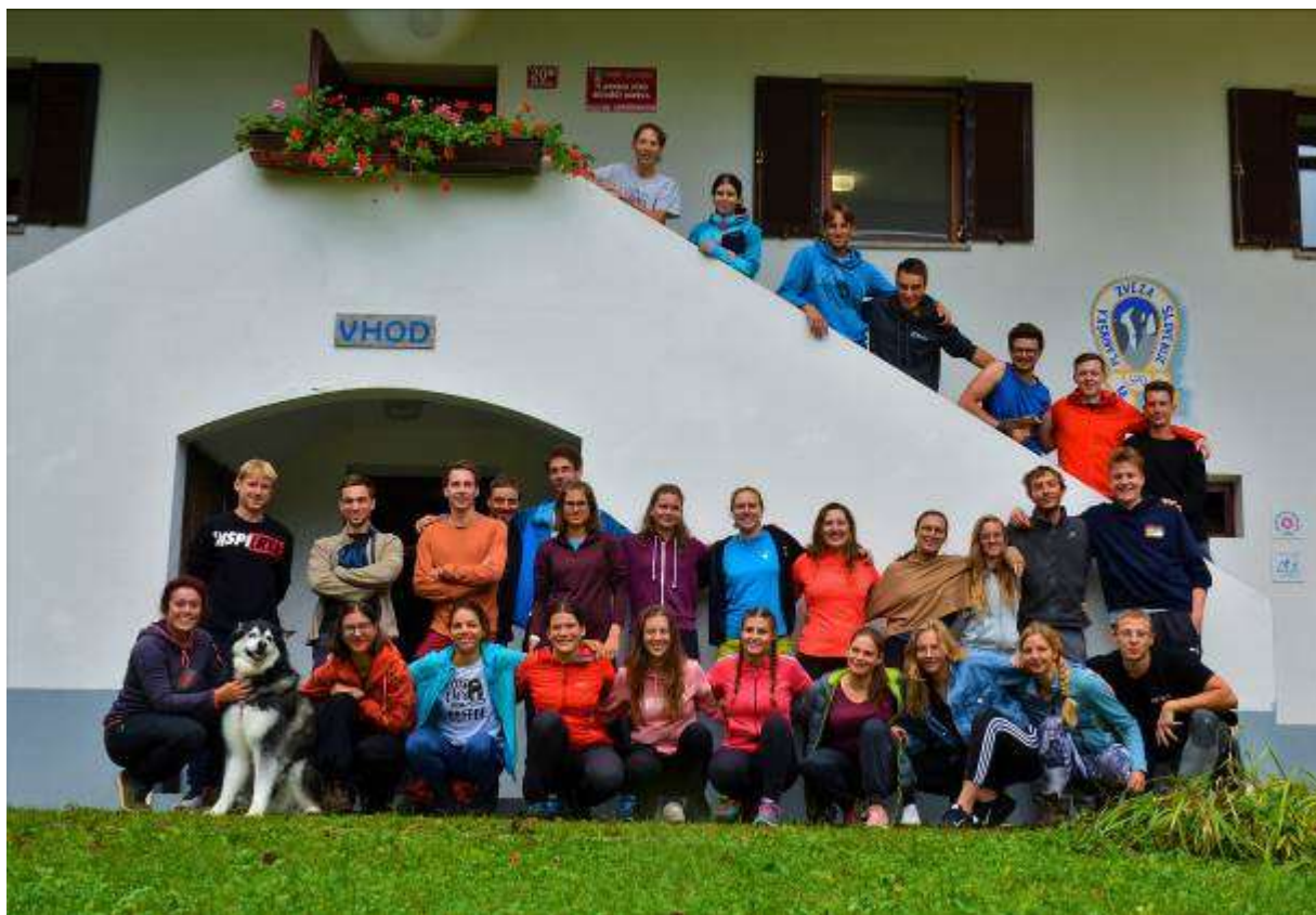
Slika 4: Študentski tabor 2020