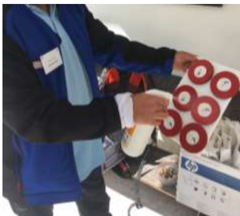
Tečaj A – Vrata (foto: Janko Šeme, Razkuževanje pripomočkov)

Odbor za usposabljanje pripravlja strokovno literaturo ter druge strokovne pripomočke, organizira tečaje, seminarje, predavanja ter druge oblike izobraževanj in usposabljanj za markaciste. Odbor za usposabljanje KPP je na tej osnovi že v letu 2017 prenovil program usposabljanja za markaciste PZS. V letu 2020 sta bila izvedena dva tečaji za markaciste kategorije A, eden od teh v sodelovanjem s KTK. En tečaj A pa je moral biti zaradi Covid19 prestavljen v 2021. Obeh tečajev se je udeležilo in ga uspešno opravilo 43 tečajnikov. Tečaj za kategorijo B je bil zaradi omejitev gibanja in zbiranja na račun COVID19 prestavljen v 2021. Po sklepu OUP PZS so bila odpovedana tudi vsa obnovitvena usposabljanja. Markacistom so se licence avtomatično podaljšale za eno leto.