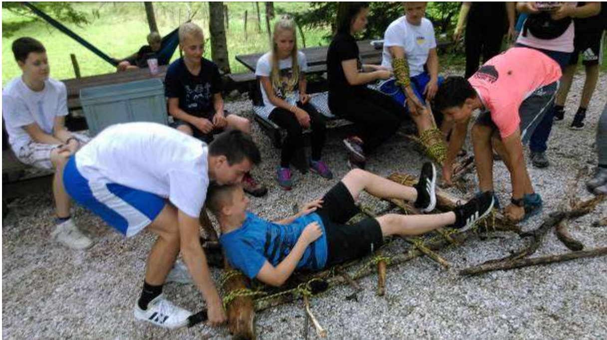
Slika 3: Nagradni tabor 2020