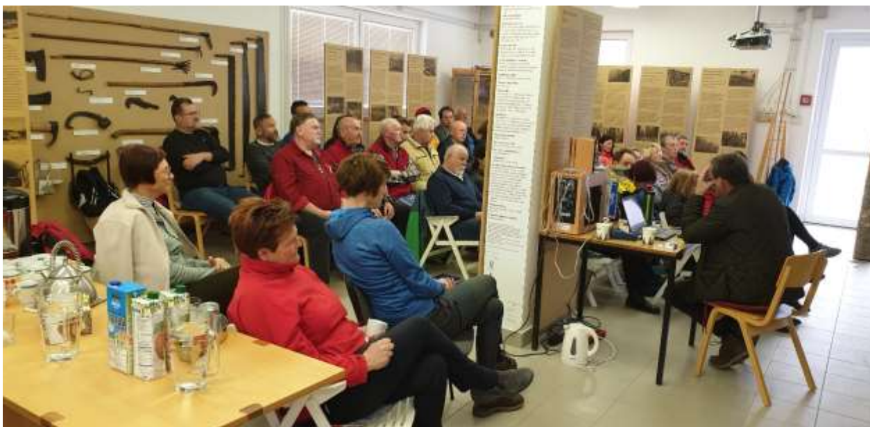
13. tečaj za GS v Kočevju, 29. 2. 2020

Tradicionalnega letnega zbora načelnikov VGN, VGN in GS zaradi COVID-12 v jesenskem delu odbor za VGN ni izvedel. Načrt dela za leto 2021 so sprejeli v dopisni obliki.