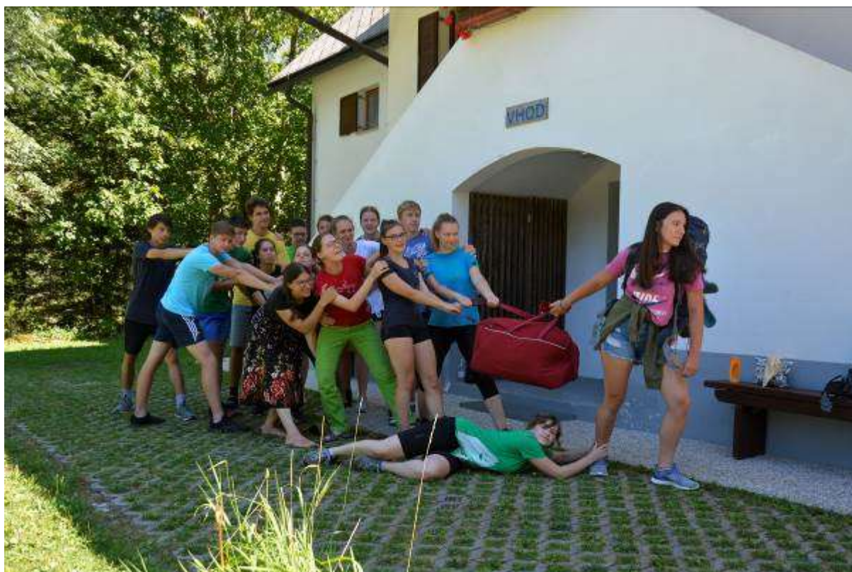
Slika 2: Mladinski voditelj, 2020, foto: arhiv MK PZS