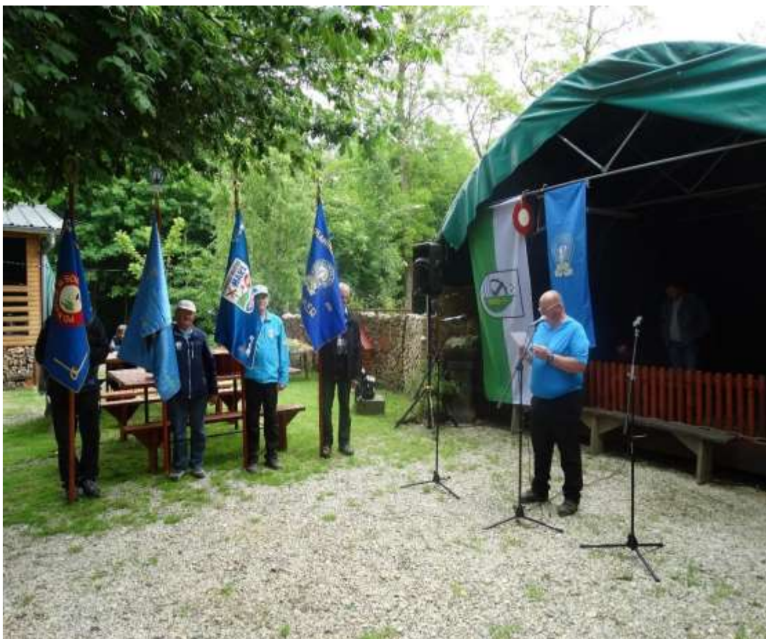
Srečanje Pomurskih planincev

Pomurja katerega združuje sedem društev ( PD Matica Murska Sobota , PD Gornja Radgona , PD Lenart , PD Hakl Sveta Trojica , PD Ljutomer , PD Lendava , PD Goričko Tromeja ). Skupni cilji in naloge so predvsem na pridobivanju članstva predvsem mladega kadra, na pridobivanju vodnikov , markacistov in mentorjev mladinskih skupin , spodbujanje mladine in uvajanje v planinstvo in planinske šole po društvih, večji poudarek je na usposabljanju in dodatnem izobraževanju strokovnega kadra in ostalih članov MDO PD Pomurja kakor tudi sodelovanje s planinskimi organizacijami na obrobju dežele.