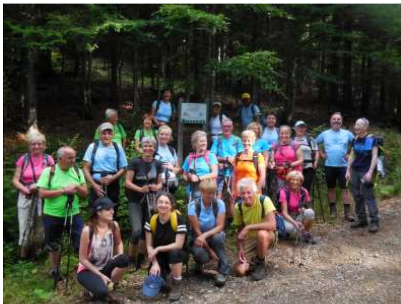
Naravovarstveni planinski izlet travnik-Komen

Izveden je bil 18. junija 2020 v dopisni obliki. Udeležilo se ga je 62 odsekov VGN planinskih društev od skupno 113 (55 %).