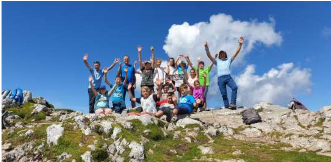
Odbor za planinske poti: