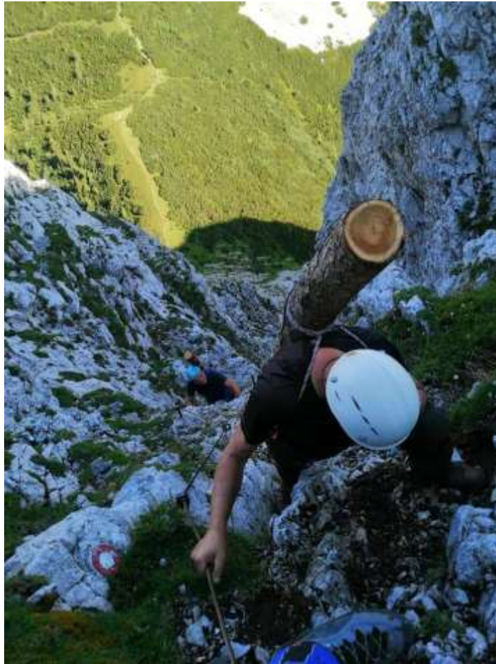
Delovna akcija Veliki vrh v Košuti, (foto: Jurij Videc)

Komisija za planinske poti je strokovni organ PZS, določen v Statutu PZS, ki usmerja, usklajuje in pospešuje dejavnosti na področju planinskih poti. Deluje po določilih Pravilnika o delu KPP, Statuta PZS in Častnega kodeksa slovenskih planincev ter ZPlanP.