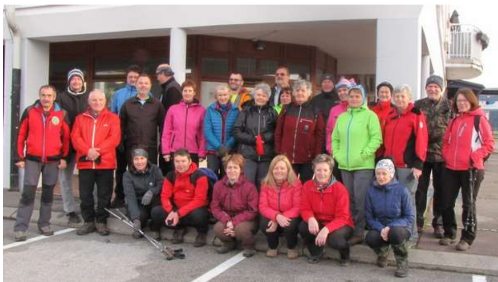
NV pohod na Goro Oljko