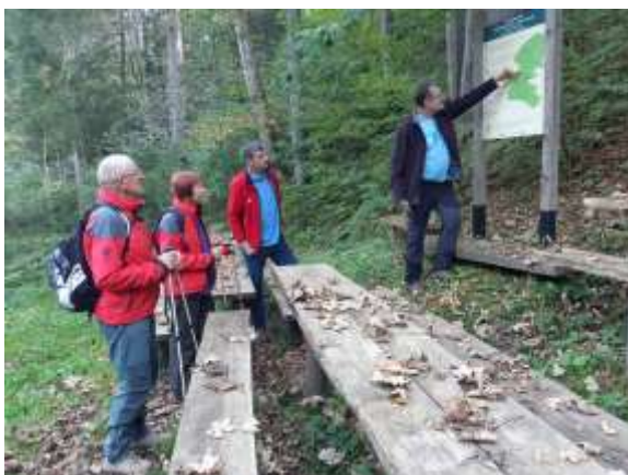
Srečanje varstva gorske narave v Podvolovljeku (nadomestni dogodek za DSP)