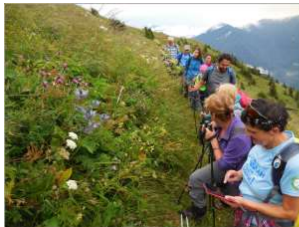
Dnevi alpske možine