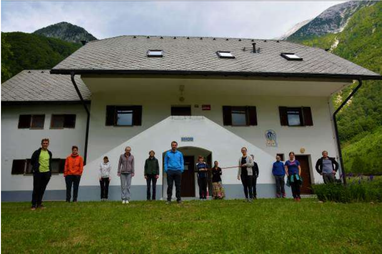
Slika 1: Delovna akcija 2020 v PUS Bavšici PZS

Mladinska komisija je eden izmed najmočnejših členov Planinske zveze Slovenije, ki skrbi za najmlajšo populacijo ljubiteljev planin in gora. Mladinska komisija pokriva različna področja - od orientacije, dela mladih, dela za mlade, finančno podpiramo akcije naših članov (mladinskih odsekov) ter jim nudimo strokovno podporo pri njihovem delovanju. V skrbništvu imamo Planinsko učno središče Bavšica in taborni prostor Mlačca, z obema skrbno upravljamo. Sodelujemo na različnih projektih znotraj in zunaj meja Slovenije. Šest let imamo status nacionalne mladinske organizacije ter status mladinske organizacije v javnem interesu v mladinskem sektorju. Sodelujemo z mladinskimi in prostovoljnimi organizacijami v Sloveniji (MSS, ZTS, ZSKSS ...), kot stalni člani Youth Commission UIAA pa smo aktivni tudi v največji mednarodni planinski organizaciji.