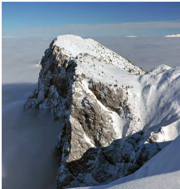
Pogled na Debelo peč in njeno prepadno steno z Brd

zavijemo desno v lep macesnov gozd. Sprva hodimo zložno, višje se strmeje povzpemo na planotast svet pod Lipanskimi vrati, 1898 m, čez katera vodi pot v Krmo. Nadaljujemo desno navzgor, smo že nad gozdno mejo in dosežemo sedlo med vrhom Brda, 2009 m, na levi in Okrogležem, 1965 m, na desni. Od tod se nam