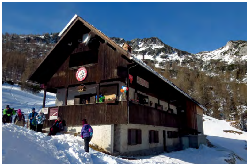
Pri Blejski koči na Lipanci

Posebna previdnost je potrebna med prečenjem pod Okrogležem in na vrhu Debele peči, ki je prepadno odsekan.